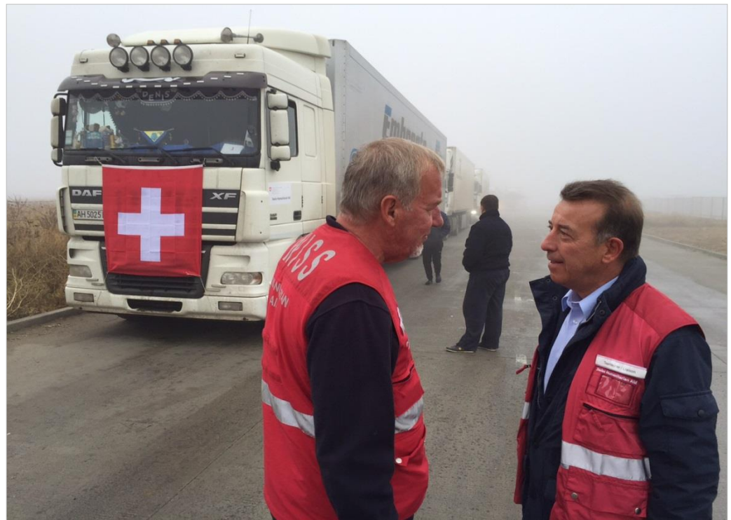
Seit April 2015 organisierte die DEZA/HH sechs humanitäre Transporte mit Material für Wasseraufbereitung und medizinischem Material in die Region Donetsk.