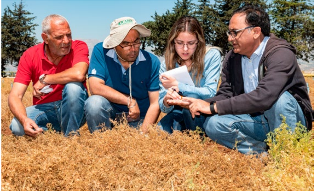
Linsenzucht des ICARDA auf der Terbol-Station im Libanon.