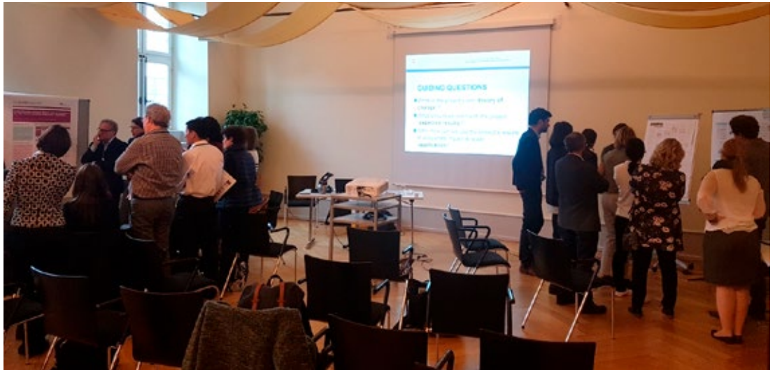
Austausch zwischen Forschenden des r4d-Programms und Mitgliedern des thematischen Netzwerks Arbeit und Einkommen der DEZA, 2019.