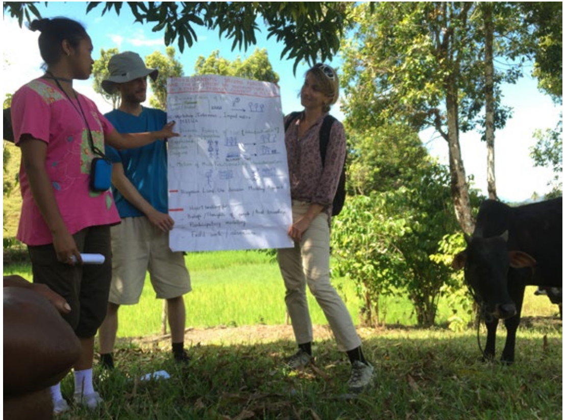
Erforschung des Einflusses der Globalisierung auf Entscheide der landwirtschaftlichen Planung in Madagaskar im r4d-Forschungsprojekt «Managing telecoupled landscapes for the sustainable provision of ecosystem services and poverty alleviation».