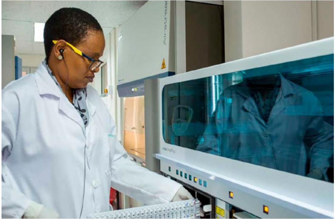
Forschung zur verbesserten HIV-Diagnose und -Behandlung in Lesotho im r4d-Forschungsprojekt «Improving the HIV care cascade».