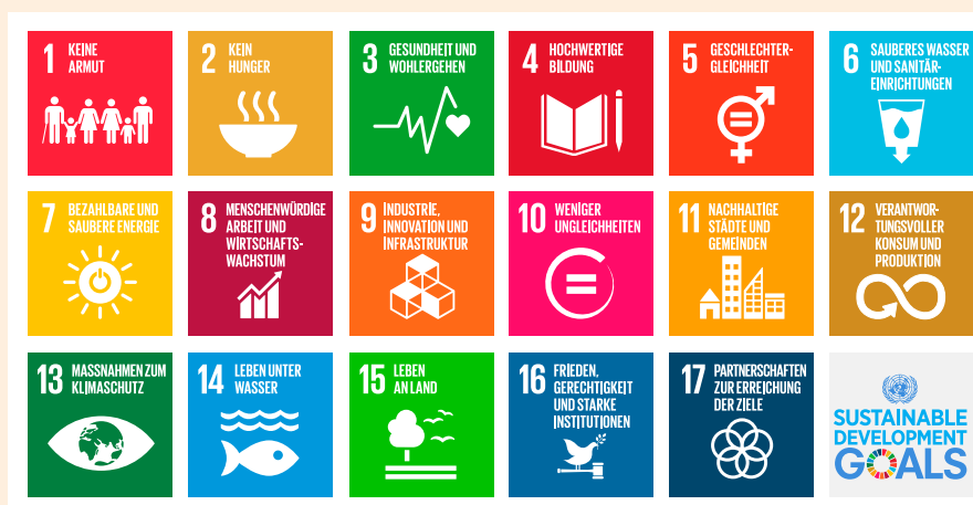
Die 17 SDGs.

Am UNO-Gipfeltreffen im September 2015 haben die Staats- und Regierungschefs die Agenda 2030 für nachhaltige Entwicklung verabschiedet. Mit der Agenda 2030 wird auch die Wissenschaft dazu aufgefordert, ihren Beitrag zum Erreichen der Ziele für nachhaltige Entwicklung (Sustainable Development Goals, SDGs) zu leisten. Gemäss dem Global Sustainable Development Report aus dem Jahr 2019 braucht es die Wissenschaft, um kreative transformative Pfade zu entwickeln, die aus sozialen, ökonomischen und politischen Sackgassen herausführen und tiefgreifende und permanente Veränderungen ermöglichen. Dazu sollte sich die Wissenschaft generell an den Zielen der Agenda 2030 orientieren, international zusammenarbeiten, Wissen systematisieren und eng mit der Politik und anderen Akteuren aus der Praxis zusammenarbeiten. 7