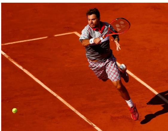
Stan Wawrinka, French Open Final 2015

Stan Wawrinkas zweiter Sieg beim Grand-Slam-Turnier in Roland Garros findet in der ausländischen Medienberichterstattung grosse Beachtung. Die Schweiz habe sich in den letzten Jahrzehnten mit Stars wie Martina Hingis, Roger Federer und nun eben Stan Wawrinka zu einer regelrechten Tennisation entwickelt, was sich auch im Gewinn des letztjährigen Davis-Cup-Sieges manifestiert habe, kommentieren die Medien. Neben seinem starken Auftritt auf dem Tennis-Court, feiert die Medienwelt auch die eigenwilligen Shorts, die Wawrinka während des Turniers getragen hat. Sie seien zwar ästhetisch gewöhnungsbedürftig, widerspiegeln aber die sympathisch selbstironische Art des Schweizer, befinden die Medien.