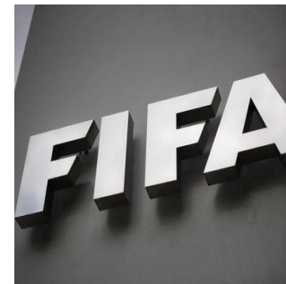
Strafverfahren eröffnet