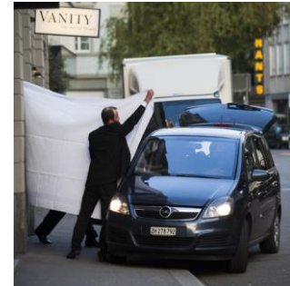
FIFA-Funktionäre in Zürich verhaftet

In gewissen Fällen werfen die Medien der Schweiz vor, zu pfleglich mit der FIFA umgegangen zu sein und erst unter Druck der USA gehandelt zu haben. Sehr kritisch beurteilen die Medien die Rolle Sepp Blatters. Die Kritik richtet sich jedoch gegen die Person des FIFA-Präsidenten und nicht gegen die Schweiz direkt. Sie hat allerdings aufgrund der von den Medien oft erwähnten Schweizer Nationalität Blatters auch eine gewisse Relevanz für die Wahrnehmung der Schweiz. Die regionalen Unterschiede in der Berichterstattung sind insgesamt klein. Am intensivsten und kritischsten wird das Thema in Europa und insbesondere in Grossbritannien verfolgt. Stark ist das Interesse auch in den USA. In den meist lateinamerikanischen Herkunftsländern der Verhafteten folgt die Berichterstattung den skizzierten Linien, allerdings mit stärkerem Fokus auf die verhafteten Personen.