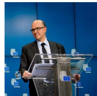
Pierre Moscovici anlässlich der Unterzeichnung des AIA-Abkommens

« Schweizer Bankgeheimnis: Das Spiel ist aus » ( Handelsblatt )