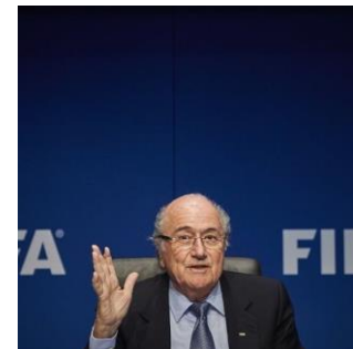
Sepp Blatter kündigt seinen Rücktritt an