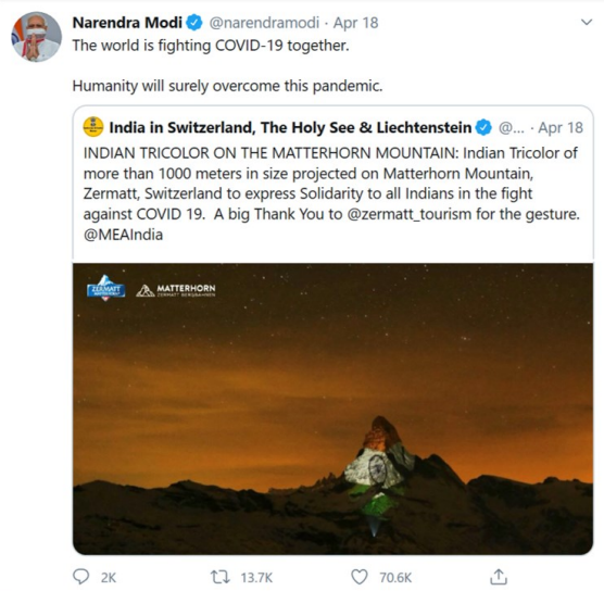
Tweet du premier ministre indien Narendra Modi

La projection sur le Cervin de messages de solidarité et des drapeaux des pays particulièrement touchés par la pandémie de COVID-19 pendant cinq semaines suscite un fort écho dans le monde entier. Le projet est conçu par Zermatt Tourisme et par l'artiste suisse Gerry Hofstetter spécialisé dans la réalisation d'œuvres lumineuses. Les images des drapeaux nationaux sont reprises par les médias des pays concernés. Des articles, publiés par exemple par Fox News et par India Times, sont partagés plus de 200 000 fois sur les médias sociaux. De nombreux représentants de gouvernements étrangers de haut rang relayent également ces informations sur Twitter. « Thank you to our #Swiss friends for this beautiful message of hope and solidarity », tweete le secrétaire d'État américain Mike Pompeo. Le premier ministre indien Narendra Modi, avec ses 2,5 millions de suiveurs sur Twitter, rend également hommage à cette action. En réponse à la projection de leur emblème national, les Émirats Arabes Unis projettent une croix suisse sur la plus haute tour du monde. L'illumination du Cervin est interprétée à l'étranger comme un signe de la solidarité de la Suisse avec les pays concernés.