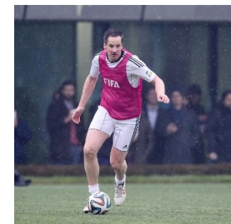
Le procureur général du canton du Valais – ici lors d'un match amical – est également cité en lien avec les rencontres entre le procureur général de la Confédération et le président de la FIFA.