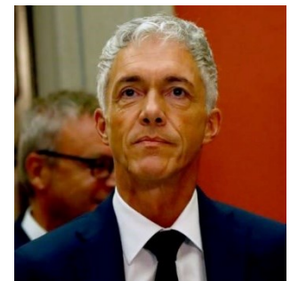
Le procureur général de la Confédération Michael Lauber

L'abandon de certains pans de l'enquête sur l'ancien président de la FIFA Joseph Blatter donne également lieu à des commentaires parfois sévères, notamment dans les médias européens et américains. Plusieurs médias accusent le MPC de partialité et dénoncent un manque de crédibilité. Dans le cadre d'une affaire de blanchiment d'argent en Russie, les médias européens et russes critiquent l'acceptation d'avantages par l'expert mandaté par Michael Lauber ainsi que l'intention du MPC de partager des déclarations de témoins sensibles avec les autorités russes, en contradiction avec les recommandations internationales. Les médias du monde entier relatent les demandes de démission formulées par des parlementaires suisses, l'audition de Michael Lauber par la commission judiciaire de l'Assemblée fédérale, l'ouverture d'une procédure de révocation contre le procureur général, ainsi que la démission de ce dernier fin juillet. Les médias voient en revanche d'un bon œil l'ouverture d'enquêtes par le MPC sur les allégations de corruption à l'encontre de Glencore en République démocratique du Congo.