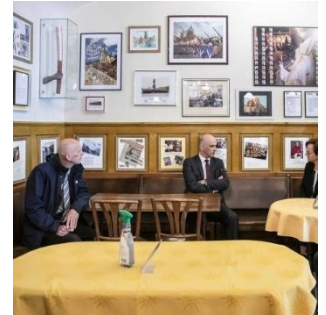
Covid-19 : Le secteur de la restauration bénéficie également de mesures d'assouplissement

relativement important durant la deuxième quinzaine d'avril. En mai, la distribution de nourriture aux personnes dans le besoin à Genève reçoit une attention mondiale, car elle semble contredire le stéréotype d'une Suisse opulente. En juin, les médias se focalisent sur diverses études selon lesquelles la Suisse serait d'un côté un pays sûr en ce qui concerne le COVID-19, mais qui présente d'un autre côté un risque accru de deuxième vague en raison de l'ampleur de l'assouplissement. Dans l'ensemble, la tonalité des médias étrangers est positive : malgré les difficultés initiales, ils estiment que la Suisse a bien géré la crise. La loi sur l'épidémie est parfois présentée comme un modèle possible pour d'autres pays.