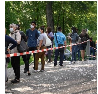
Covid-19 : Des personnes dans le besoin attendent la distribution de nourriture à Genève