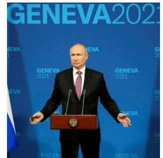
Le président russe Vladimir Poutine lors de sa conférence de presse à Genève.