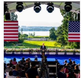
La conférence de presse du président américain Joe Biden avec vue sur le lac Léman.