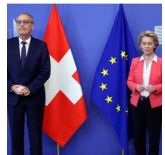
Le président Guy Parmelin rencontre la présidente de la Commission européenne Ursula von der Leyen.