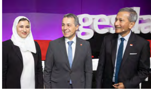
Le conseiller fédéral Ignazio Cassis, porteur du projet GESDA au sein du gouvernement suisse, entouré de Mme Sarah Bint Yousif Al Amiri, Ministre d'Etat à l'éducation et aux technologies avancées des Emirats arabes unis, et M. Vivian Balakrishnan, ministre des affaires étrangères de Singapour, lors du segment ministériel du Sommet de 2022.