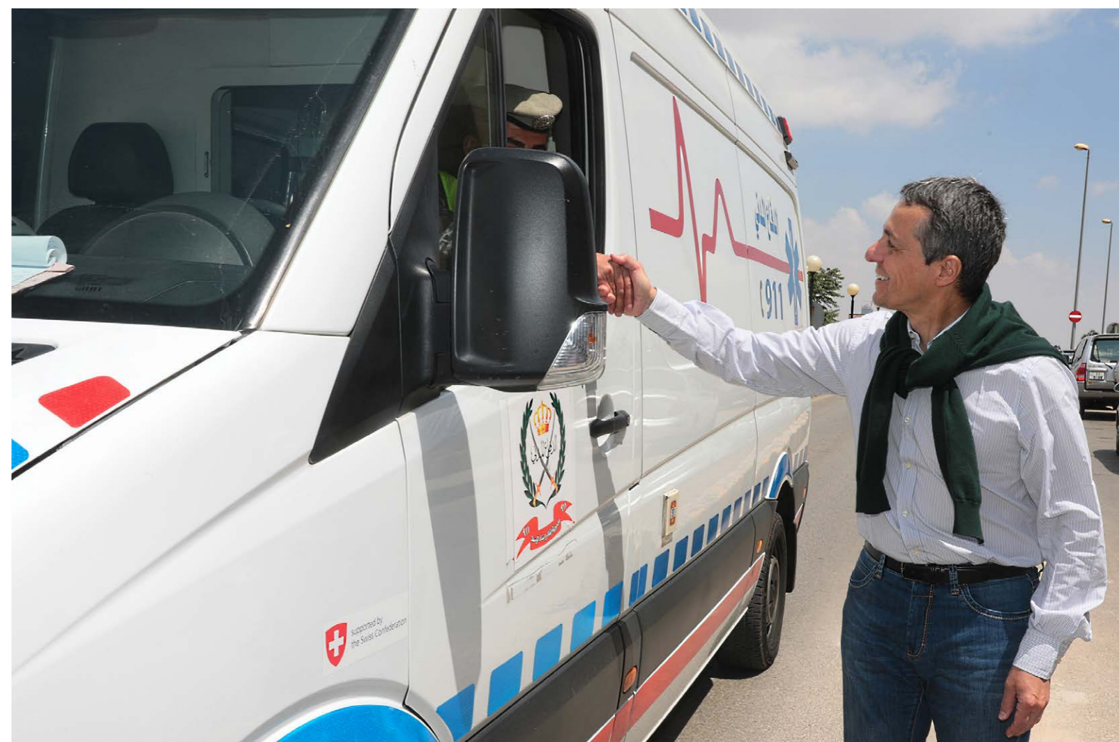
Il Consigliere federale Ignazio Cassis visita un progetto di cooperazione nel settore sanitario finanziato dalla Svizzera. Amman, Giordania, maggio 2018.

ambiti d'intervento stabiliti consentono agli organi federali coinvolti l'impiego coerente ed efficace delle risorse esistenti.