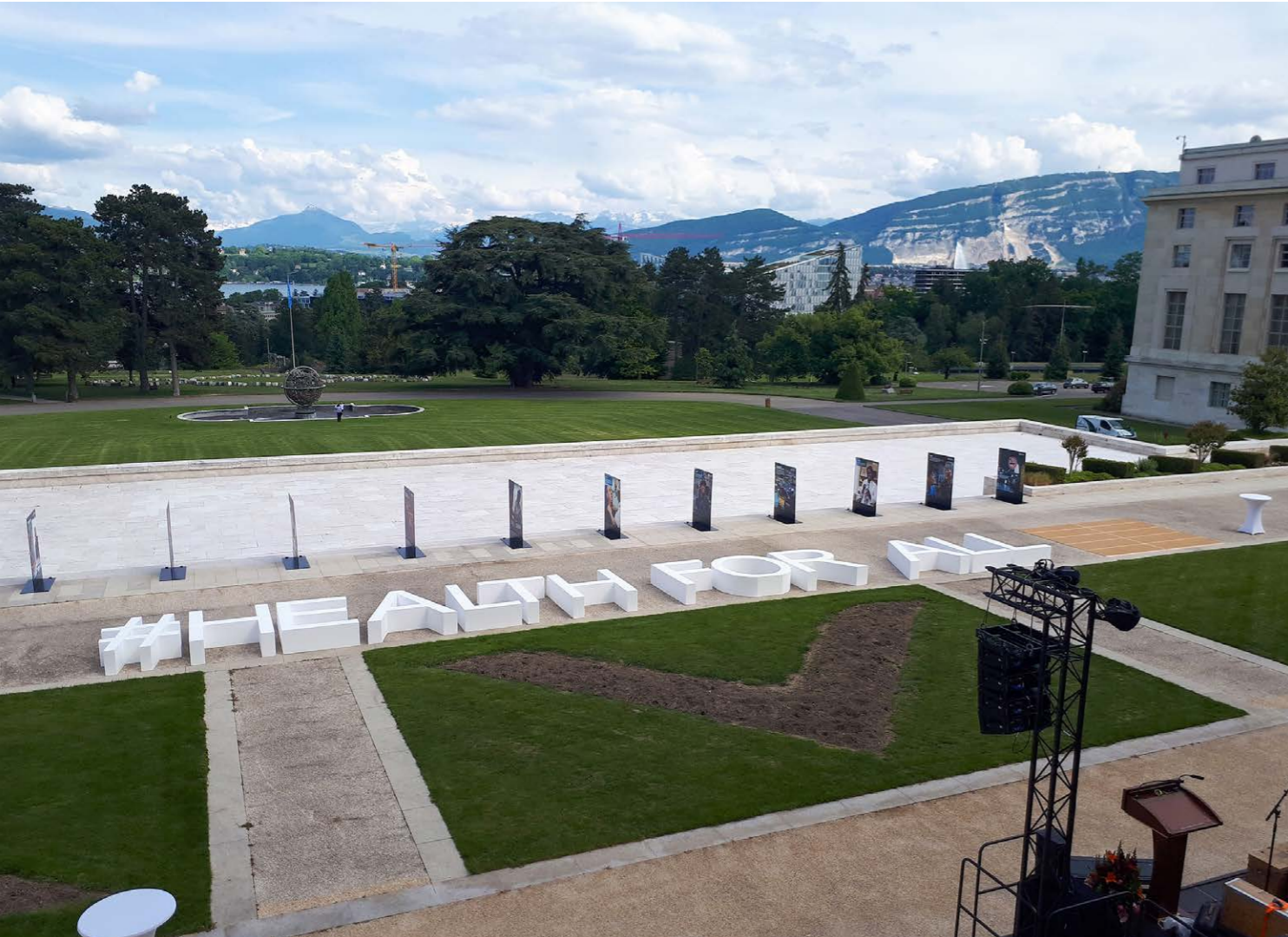
Commemorazione del 70° anniversario dell'Organizzazione mondiale della sanità (OMS), Ufficio delle Nazioni Unite a Ginevra, maggio 2018. In quanto sede dell'Organizzazione mondiale della sanità e di una miriade di altri attori impegnati nel campo della salute, la Ginevra Internazionale è un importante centro di governance nel campo della salute globale.

In passato, in Svizzera, come nella maggior parte degli altri paesi, le questioni afferenti alla politica ed assistenza sanitaria rappresentavano primariamente un tema di politica interna. Costituiscono un'eccezione le crisi sanitarie transfrontaliere che richiedono da sempre una concertazione a livello internazionale. Le malattie trasmissibili come la tubercolosi, l'HIV, l'Ebola, l'infezione da virus Zika o l'influenza aviaria, per esempio, hanno evidenziato solo recentemente l'importanza della collaborazione internazionale. Nello stesso tempo, negli ultimi trent'anni, i paesi di tutto il mondo hanno capito che la salute della popolazione è fondamentale sia dal punto di vista della politica di sviluppo sia da quello economico. La salute ha pertanto acquisito una dimensione politica sempre più rilevante, diventando oggi un punto fermo dell'agenda internazionale.