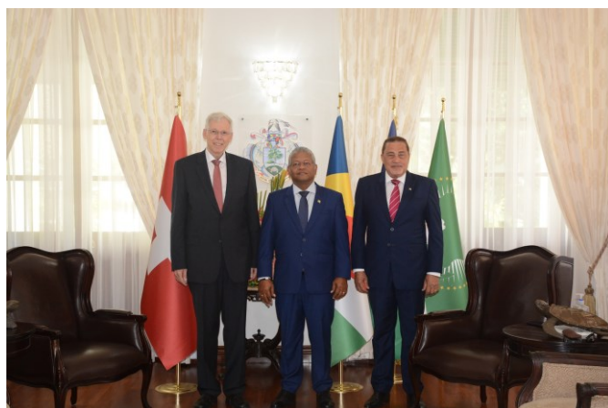
Amb. Stalder avec le président des Seychelles Wavel Ramkalawan

Des élections auront lieu à Madagascar au cours du second semestre de cette année. Les dates n'ont pas encore été officiellement confirmées, mais selon la proposition de la CENI, le premier tour des élections présidentielles aura lieu le 9 novembre, suivi du second tour le 20 décembre.