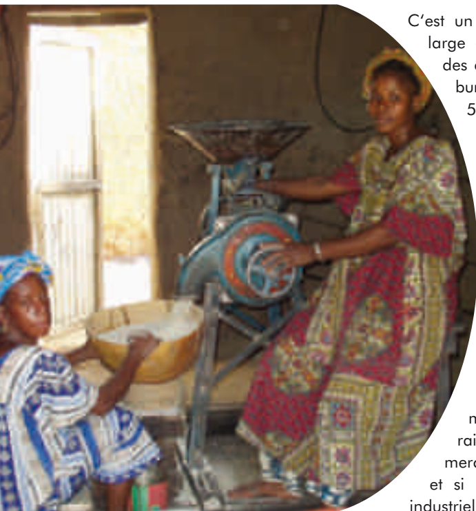
Un groupement de femmes gère le moulin à céréales du village.

La sécurité alimentaire du Burkina Faso n'est pas acquise. Le pays demeure un des plus pauvres de la planète et importe annuellement pour 78 millions de US$ de céréales, soit environ 250'000 tonnes au total de riz, blé et maïs. Cependant, le gouvernement et les institutions financières internationales ne sont attentifs qu'au coton et à son cours sur le marché international ; le coton est le seul produit pour lequel il existe une politique nationale et des instruments de soutien à la production. Le coton représente le principal revenu de l'Etat, mais ce sont les ventes de produits alimentaires qui représentent le 80% du revenu paysan.