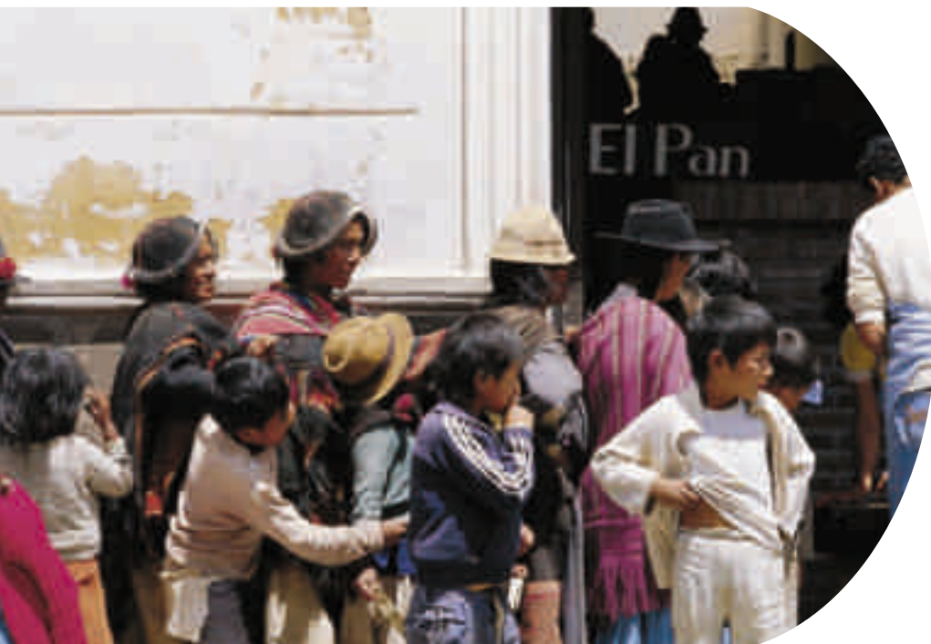
Des Boliviens font la queue pour la distribution du pain.