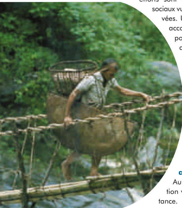
Vivres, médicaments, matériel de construction, informations passent par le pont, souvent la seule ouverture vers le monde « extérieur ».

Les familles népalaises socialement désavantagées sont contraintes de se rabattre sur des zones marginales à faible productivité et écologiquement fragiles. Cercle vicieux : sous la pression démographique, ces zones sont d'autant plus rapidement dégradées, mettant en péril la sécurité alimentaire de populations déjà très vulnérables.