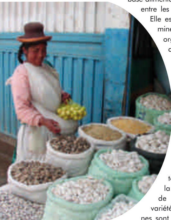
Sous forme de chuño, les pommes de terre, d'habitude plutôt délicates au stockage, peuvent être conservées plusieurs années sans se dégrader, constituant ainsi une réserve alimentaire des populations de la région.

Il convient de souligner que la chaîne commerciale créée pour ces produits de niche est issue de processus participatifs où, en association avec les chercheurs, tous les acteurs impliqués, du producteur au commerçant, déterminent ensemble le déroulement des différentes étapes. Le paysan peut ainsi se positionner sur le marché,