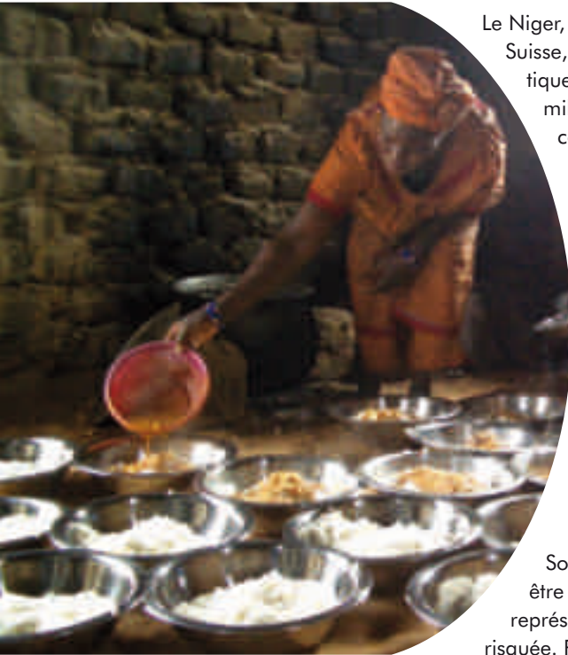
Niger : distribution de repas dans une école.

Lors d'une année particulièrement mauvaise, comme en 2004, où sécheresse prolongée et invasion de criquets ont porté une double atteinte aux récoltes, le Niger s'est trouvé rapidement face à une crise alimentaire aiguë, avec une famine menaçant une grande partie de sa population.