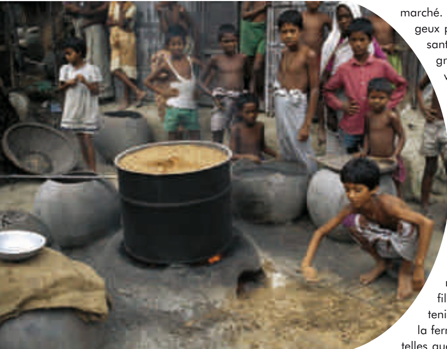
Transformation des produits. Cuisson du riz pour faciliter le décorticage des balles, Bangladesh.