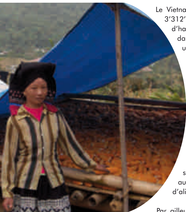
Le bon stockage est indispensable pour l’obtention d’un produit de qualité. Séchage d’épis de maïs avant le conditionnement en farine. Commune de Cao Son, Vietnam.

Les incitations du marché motivent les producteurs, commerçants, transporteurs et entreprises de services et de transformation à organiser des filières performantes. Celles-ci apportent non seulement des plus-values aux producteurs et aux intermédiaires, mais elles assurent aussi un approvisionnement en quantité et qualité suffisantes pour les consommateurs urbains.