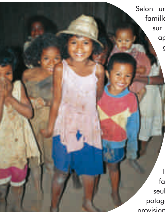
Les enfants sont l'avenir du pays ! Ils appartiennent aux groupes les plus vulnérables sur le plan alimentaire.

La sécurité alimentaire dépend d'une organisation et d'une collaboration étroite entre les communautés de base, la société civile, les collectivités décentralisées et les services gouvernementaux. Le renforcement et la structuration de l'organisation du milieu rural est d'un intérêt vital sur le plan alimentaire, notamment pour les communautés particulièrement vulnérables.