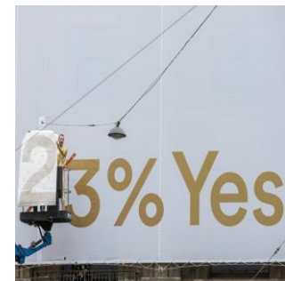
Votation sur le revenu de base inconditionnel

«Guaranteed Income for All? Switzerland's Voters Say No Thanks» (The New York Times)