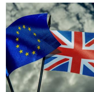
Referendum de la Grande-Bretagne sur l'appartenance à l'Union européenne. (© L'Obs)

«Swiss route poses challenge for Brexit UK» (Financial Times)