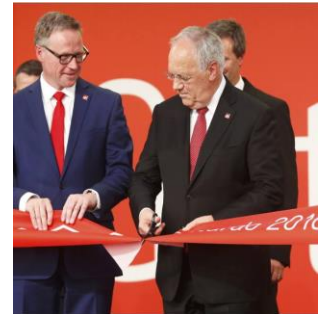
Le président de la Confédération Johann Schneider-Ammann inaugure le tunnel du Gothard.

«Mythos Gotthard-Tunnel: Der Jahrhundertbau» (Der Spiegel)