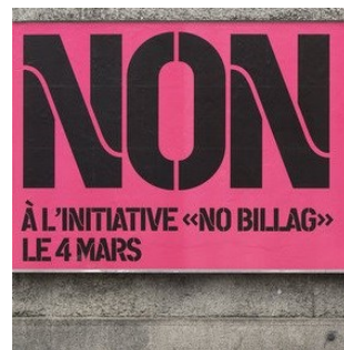
Campagne contre l'initiative No Billag

«Die Schweiz erscheint manchmal wie ein politisches Versuchslabor» (FAZ, Allemagne)