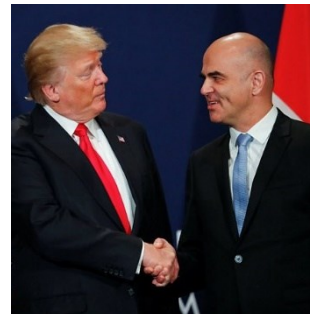
Le président de la Confédération Alain Berset et le président américain Donald Trump au WEF à Davos

Si en eux-mêmes les comptes-rendus sont plutôt factuels, les images qui les accompagnent montrent des banderoles avec des slogans parfois véhéments vis-à-vis de Trump. Une photographie des protestations se retrouve même en première page de l'édition internationale du New York Times.