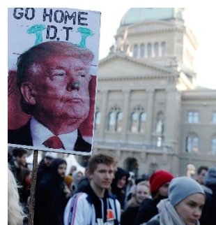
Manifestation à Berne contre la visite de Donald Trump au WEF