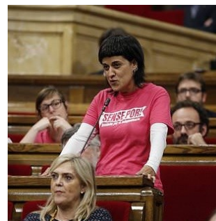
La séparatiste catalane Anna Gabriel en Suisse

«La anticapitalista Anna Gabriel huye de la justicia y se instala en el símbolo mundial del capitalismo, Suiza» (20 minutos, Espagne)