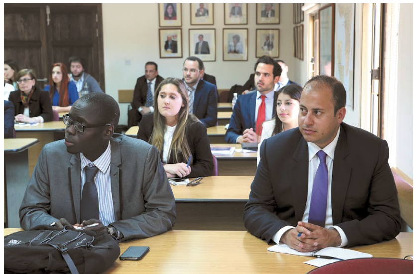
Dans le cadre d'un master à l'Académie méditerranéenne d'études diplomatiques (MEDAC), 60 jeunes diplomates en provenance d'Afrique du Nord et du Moyen-Orient ont pu approfondir leurs connaissances concernant les droits de l'homme, la démocratie et la gouvernance.

a renforcé le rôle de Malte en tant que médiateur entre l'Europe et l'Afrique du Nord. Pendant la période 2010-2015, des bourses ont permis à 60 jeunes diplomates en provenance d'Afrique du Nord et du Moyen-Orient d'acquérir des connaissances importantes dans les domaines des droits de l'homme, de la démocratie et de la gouvernance. Le développement d'un réseau de diplômés renforce les contacts entre les anciens étudiants, et contribue ainsi à la coopération entre les pays de la Méditerranée. La chaire financée par la Confédération a renforcé le partenariat entre la Suisse et Malte, et des enseignants suisses ont eu la possibilité de donner des cours auprès de la MEDAC. Dans le cadre de la contribution à l'élargissement, la Suisse a accordé à la MEDAC un montant de 1,9 million de francs. La collaboration entre les deux pays se poursuivra après la fin du projet.