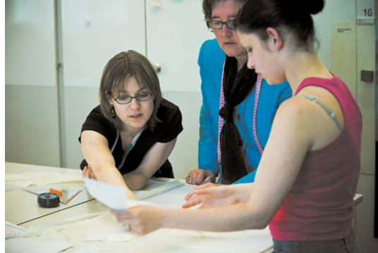
Une délégation croate a visité plusieurs écoles professionnelles et entreprises suisses de différentes branches pour se faire une idée sur place du système suisse de formation duale.