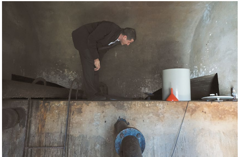
Dans la commune de de Fužine, en Croatie, un expert suisse examine le réservoir d'eau potable, qui date de 1960.