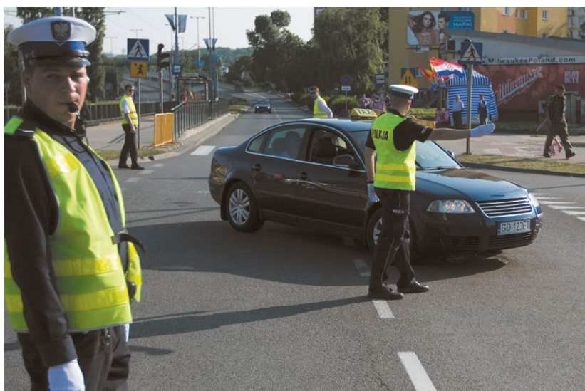
Plus de 600 membres de la police polonaise ont reçu une formation sur le thème de la sécurité routière, ce qui permet une surveillance du trafic plus efficace et efficace.

times. La révision de la loi polonaise montre la portée potentielle d'un projet au niveau politique et les changements positifs que peuvent apporter le dialogue bilatéral et la transmission de l'expertise suisse.