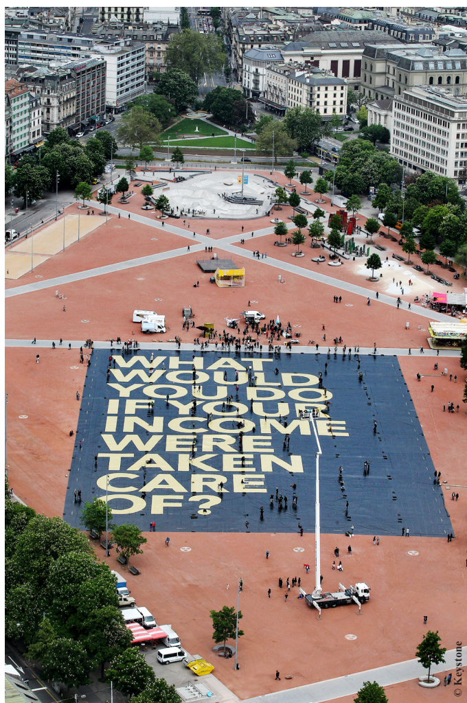
La campagne en faveur de l'initiative populaire « Pour un revenu de base inconditionnel », ici à Genève, a été relayée dans le monde entier

La couverture médiatique des votations suisses à l'étranger évolue souvent selon un même schéma. On observe tout d'abord la parution de quelques articles disséminés. Par la suite, ce sont des facteurs tels que l'intérêt manifesté, l'existence de débats semblables dans le pays en question et l'intensité de la campagne autour de l'initiative qui déterminent le volume de l'information consacrée à la Suisse.