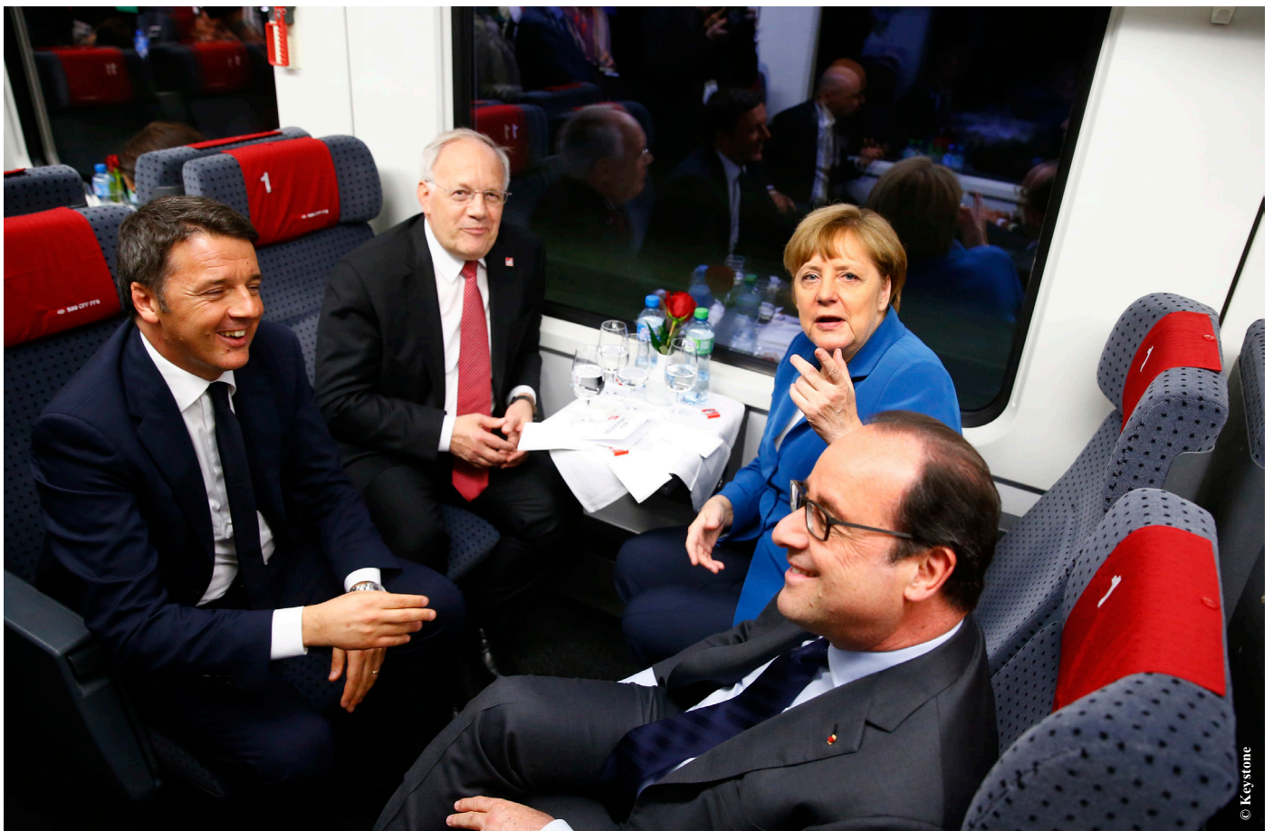
Rencontre au sommet dans les profondeurs de la terre: le président de la Confédération Johann Schneider-Ammann, le président français François Hollande, la chancelière allemande Angela Merkel et le premier ministre italien Matteo Renzi lors de la traversée inaugurale du tunnel de base du Saint-Gothard à bord d'un train CFF