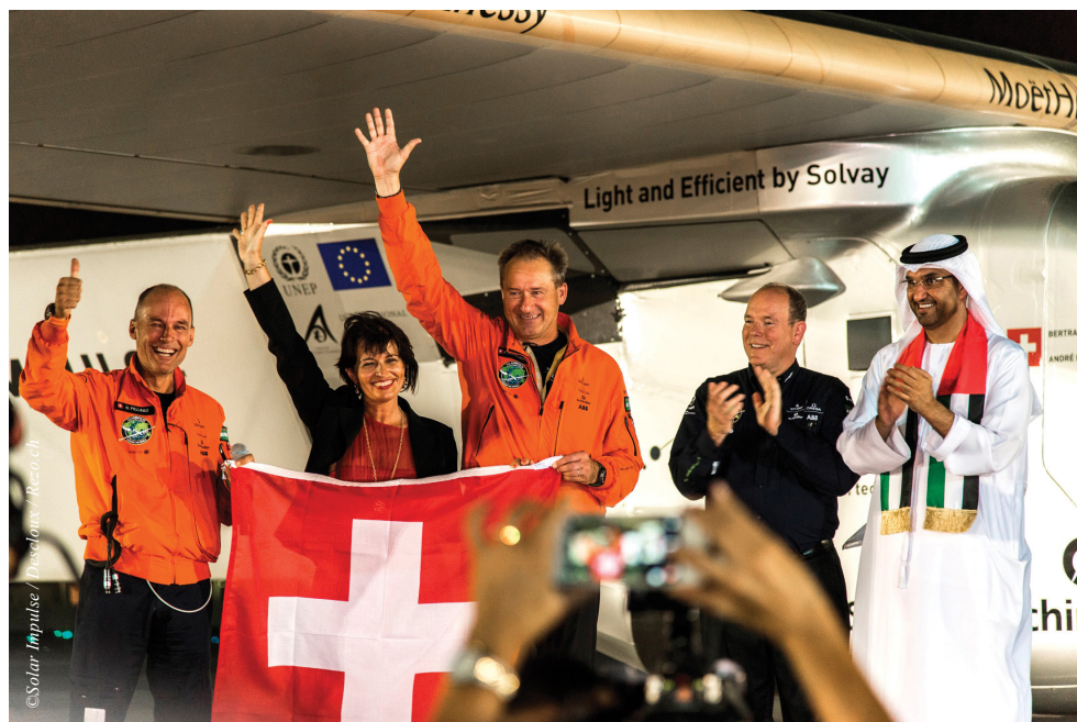
Ambassadeurs de l'innovation : les pilotes Bertrand Piccard et André Borschberg fêtent aux côtés de la conseillère fédérale Doris Leuthard la réussite du tour du monde de Solar Impulse

L'inauguration du tunnel de base du Saint-Gothard, le 1 er juin 2016, a également figuré parmi les grands sujets médiatisés à l'étranger. La présence de personnalités politiques européennes de premier plan, dont la chancelière allemande Angela Merkel, le premier ministre italien alors en fonction Matteo Renzi, le président français François Hollande et le chancelier