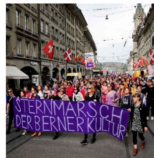
La grève des femmes à Berne

différends entre la Suisse et l'UE sont jugés préjudiciables à toutes les parties concernées. Quelques médias se positionnent néanmoins clairement pour ou contre la Suisse. C'est principalement dans les médias allemands et autrichiens que l'on trouve des commentaires critiques à l'égard de la position du gouvernement suisse, jugée parfois trop hésitante. Dans le contexte du Brexit, de nombreux médias britanniques se montrent en revanche plutôt solidaires avec la Suisse.