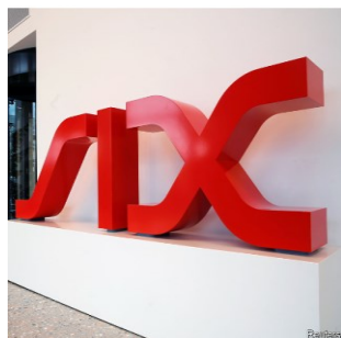
Des images symboliques de la Bourse suisse illustrent des articles consacrés aux relations entre la Suisse et l'UE