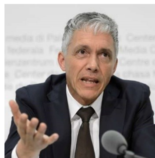
FIFA: le procureur Michael Lauber récusé par la justice suisse