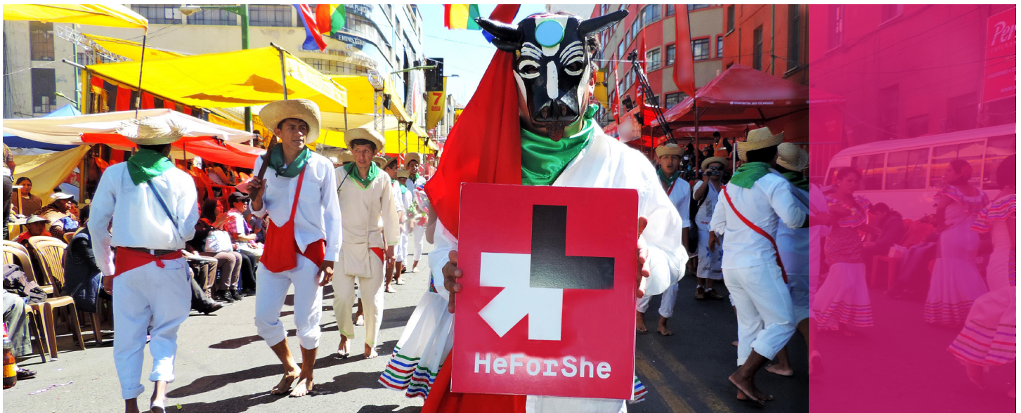
Cientos de bailarines se unieron a la campaña HeForShe en la entrada universitaria.