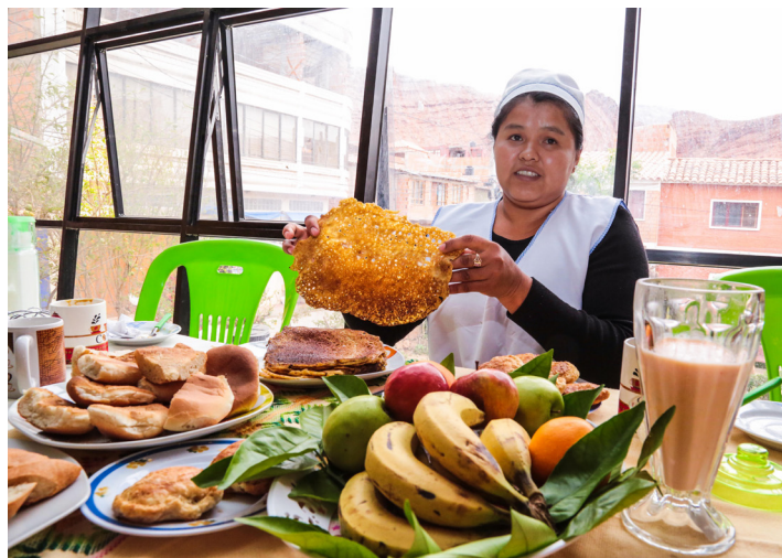
Productos con frutas, harina y otros fueron presentados

» M ercados Rurales es el proyecto que permite el empoderamiento económico de 280 mujeres emprendedoras del Valle de los Cintis.