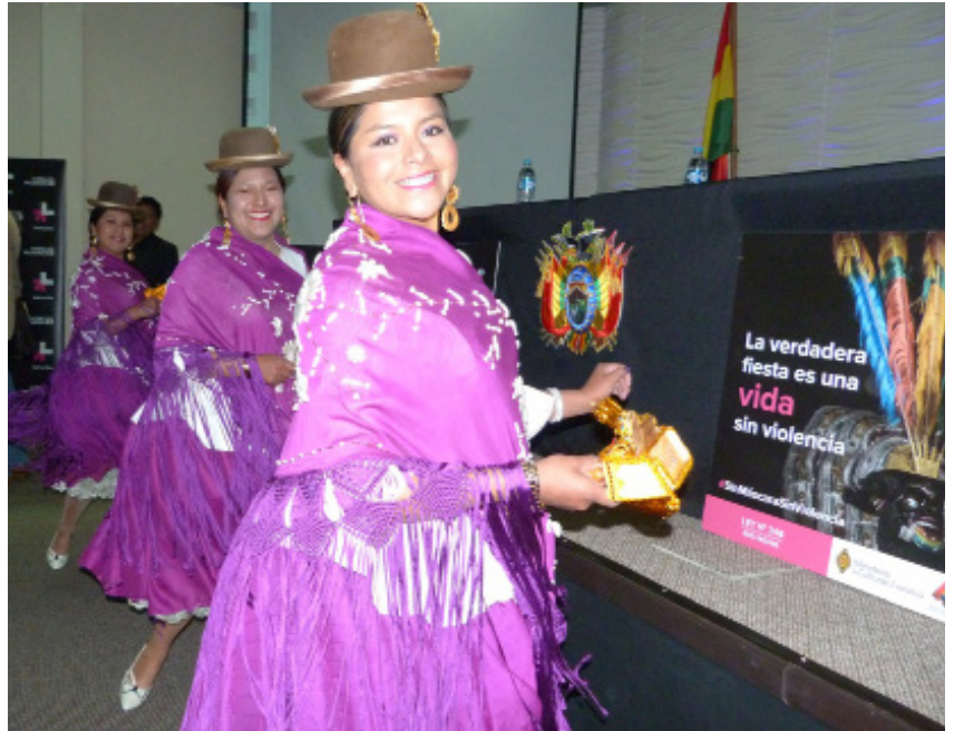
Bailarines promocionaron la campaña HeForShe de la zona 16 de Julio.

“Sin Máscaras, Sin Violencia”, permite reflexionar sobre el rol de los hombres en una sociedad machista y patriarcal donde la violencia muchas veces se oculta. Además la campaña invita a sacarse las máscaras y decirle no a la violencia a través de la información, prevención, sensibilización y denuncia de los casos que dañan la integridad física, sexual o psicológica de las mujeres y niñas.