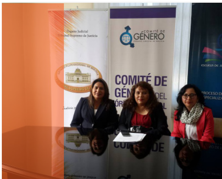
Integrantes del Comité de Género del Órgano Judicial