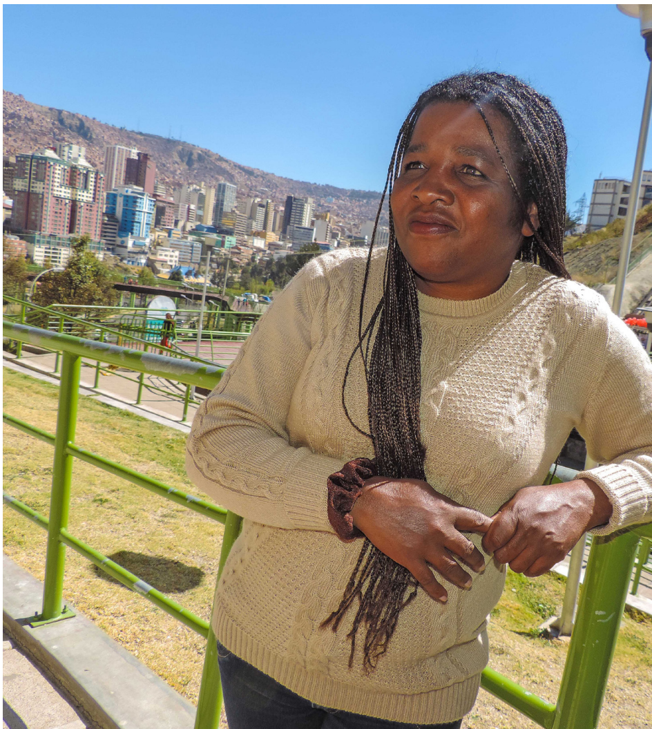
Mónica Rey actualmente funge como diputada nacional.

M ónica Rey nació en el Municipio de Coroico, Yungas, la región donde vive la mayor cantidad de población afroboliviana. Allí vivió hasta los 11 años, y desde entonces tuvo que aprender a defenderse del racismo.