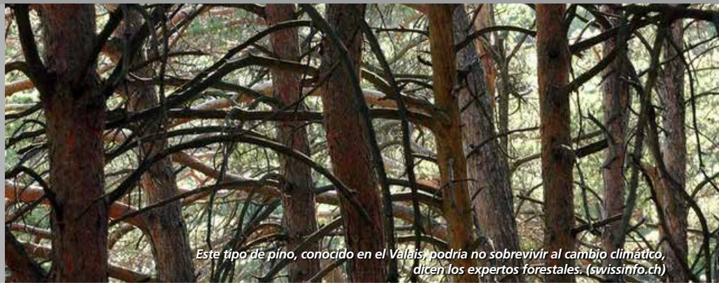
Este tipo de pino, conocido en el Valais, podría no sobrevivir al cambio climático, dicen los expertos forestales. (swissinfo.ch)

Es un hecho que mientras las temperaturas globales han aumentado en 0.85 grados Celsius en promedio desde el comienzo de la industrialización, Suiza se ha calentado en 1.8 grados