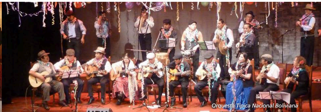
Orquesta Típica Nacional Boliviana