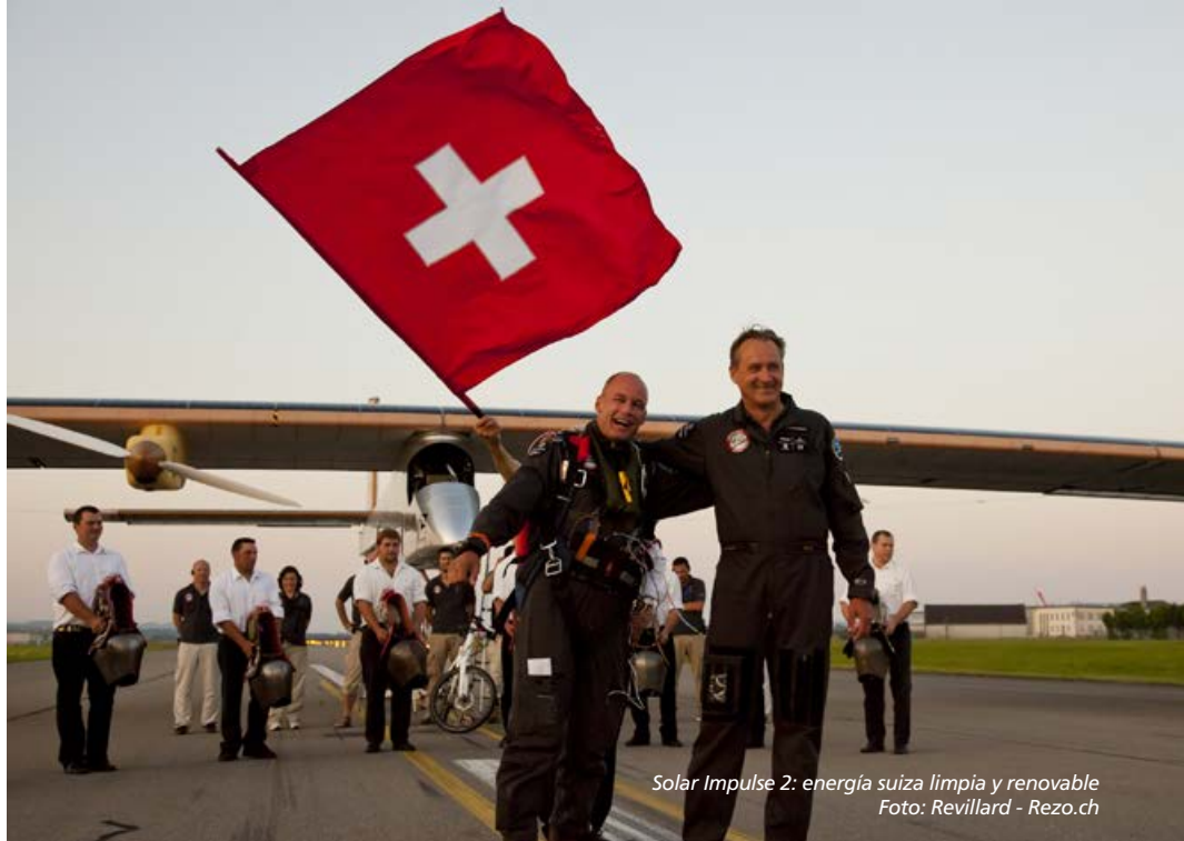
Solar Impulse 2: energía suiza limpia y renovable