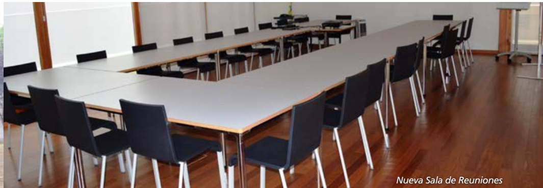
Nueva Sala de Reuniones