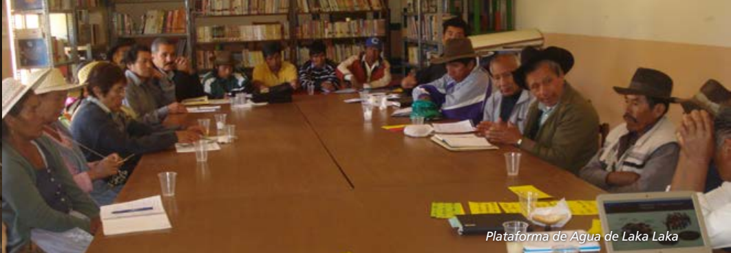
Plataforma de Agua de Laka Laka