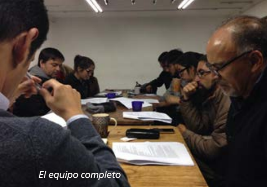
El equipo completo