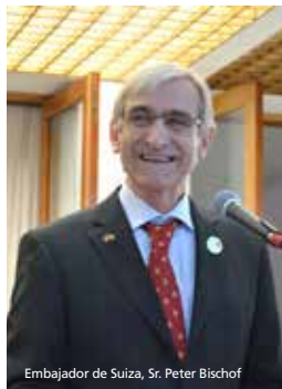
Embajador de Suiza, Sr. Peter Bischof