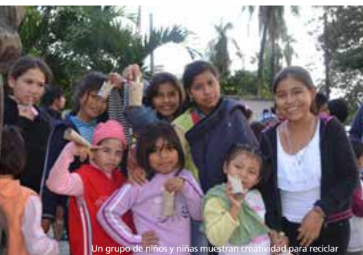
Un grupo de niños y niñas muestran creatividad para reciclar

Más información en: www.boliviafestijazz.com – http://www.christydoran.ch/nb/ http://www.youtube.com/watch?v=DoC777mlg4A