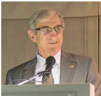
Peter Bischof Embajador de Suiza en Bolivia

Los grandes desafíos de nuestro tiempo son de carácter global. Suiza quiere asumir su responsabilidad. Quiere defender sus intereses y aportar para que el mundo tenga mejores posibilidades de paz y mejores oportunidades para las próximas generaciones ¡Un mundo de la gente y para la gente! Buena lectura, estimados lectores y lectoras, espero que esta nueva edición sea de su agrado.