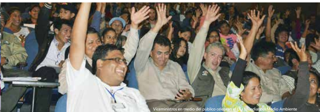
Viceministros en medio del público celebran el Día Mundial del Medio Ambiente