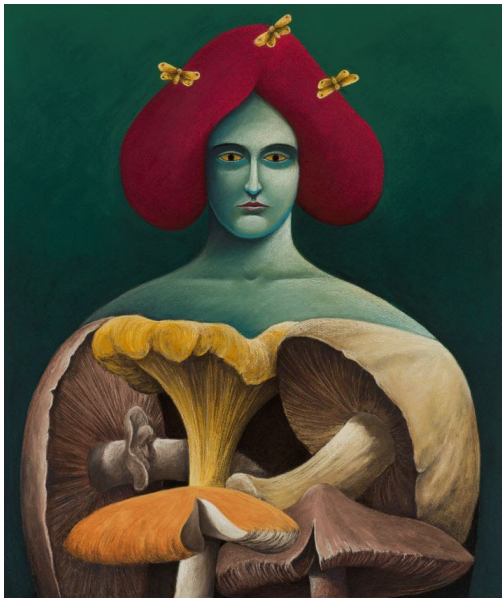
Nicolas Party, Portrait avec champignons , 2019, Zurich.