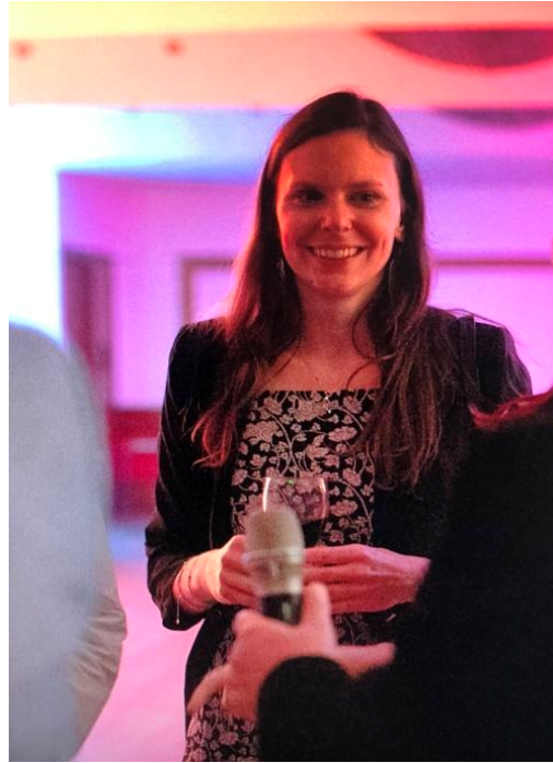
Melanie Atzenweiler © Embajada de Suiza en Chile