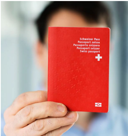
Nuevo pasaporte suizo

Desde el 31 de octubre de 2022, el nuevo pasaporte suizo puede solicitarse en las oficinas cantonales de pasaportes o en las representaciones suizas en el extranjero, siendo todos los otros documentos de identidad emitidos hasta entonces, válidos hasta la fecha de caducidad indicada en ellos.