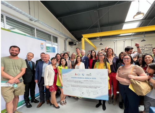
Lanzamiento de la Estrategia Hídrica Local en Renca