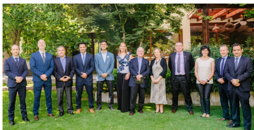
Representantes de AQUA4D junto al equipo de la Embajada de Suiza y Swiss Business Hub Chile

En el marco de la visita a Chile de los miembros del Consejo Europeo de Innovación (EIC) y de los Directores Corporativos de la empresa suiza AQUA4D , el Swiss Business Hub de Chile organizó un desayuno en la Residencia del Jefe de Misión Adjunto de la Embajada de Suiza, con el objetivo de abordar soluciones sostenibles en el ámbito