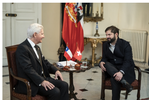
Embajador Markus Dutly junto al Presidente Gabriel Boric

El 15 de septiembre el Embajador Markus Dutly hizo entrega de sus cartas credenciales al Presidente Gabriel Boric en el palacio de La Moneda. Esta es la ceremonia de acreditación oficial ante la máxima autoridad del país anfitrión que los embajadores(as) deben realizar para ser reconocidos como tal. Con esta ceremonia, nuestros países continúan reforzando sus excelentes relaciones amistad y cooperación