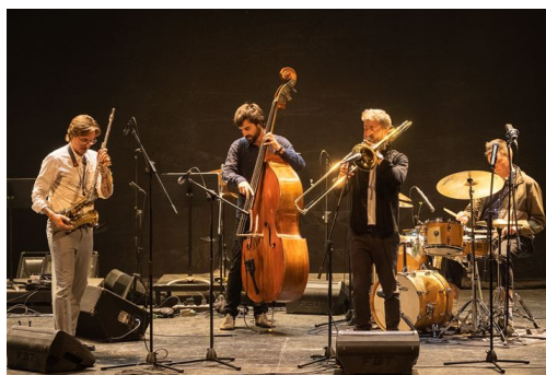
Presentación de uno de los conciertos de Woodoism

Este año la edición del Festival de Jazz ChilEuropa volvió a tener lugar de forma presencial en la Sala Master de la Universidad de Chile . Suiza estuvo representada por el joven cuarteto Woodoism , quien congregó a un gran público en los conciertos gratuitos, los que fueron transmitidos en vivo por la Radio Universidad de Chile (102.5 FM).