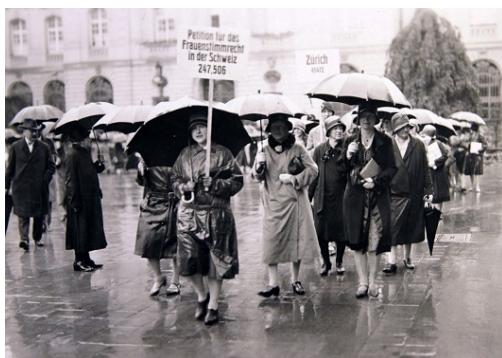
© De la cocina al Parlamento, película

En el marco de la muestra Democracia Directa Moderna , la Casa-Museo Eduardo Frei Montalva estuvo proyectando durante el mes de agosto el documental suizo “ De la Cocina al Parlamento ” que relata la lucha de las mujeres suizas por la obtención de su derecho a voto.