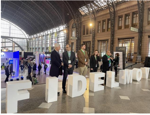
Embajador Dutly en la inauguración de la FIDELMOV

DELMOV, volvió al formato presencial y se desarrolló en el Centro Cultural de la Estación Mapocho. El Embajador Markus Dutly participó en el panel de conversación inaugural, donde presentó la amplia experiencia suiza en la movilidad sostenible.