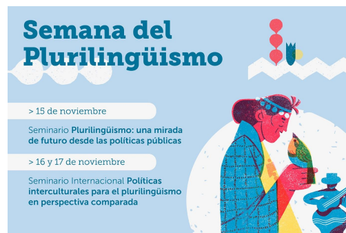
Actividades de la Semana del Plurilingüismo

Entre el 14 y el 18 de noviembre se desarrollaron múltiples actividades para fomentar el plurilingüismo en Chile junto a los Ministerios de las Culturas y de la Educación, a UNESCO, ONU y las Universidades Católica y de la Frontera. El uso de más de una lengua contribuye al entendimiento pacífico de las culturas. Suiza, al ser un país plurilingüe, promueve esta práctica como un vector de inclusión capaz de fortalecer la democracia.