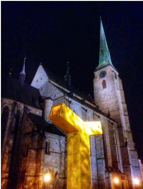
Kulturhauptstadt Pilsen 2015 Capitale culturelle Pilsen 2015

Nach einem Höflichkeitsbesuch beim regionalen Landeshauptmann Vaclav Slajs diente der Besuch der westböhmisches Universität dem besseren Kennenlernen dieser grossen Ausbildungsstätte. Ein Vortrag vor den Studenten der deutschsprachigen Fakultät zur viersprachigen Schweiz erlaubte einen interessanten Gedankenaustausch.