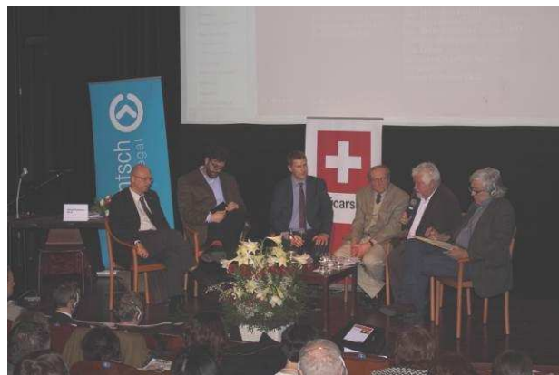
Teilnehmer der Podiumsdiskussion Participants au débat