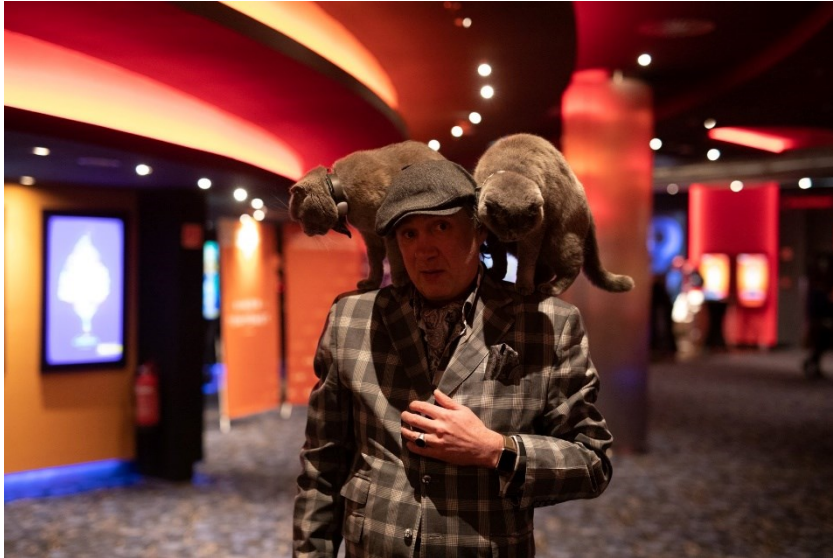
Christian Amann / Foto: BDF

Das Budapester Internationale Dokumentarfilmfestival fand zwischen dem 27. Januar und dem 2. Februar 2020 statt. Bei der Vorstellung der neuesten Dokumentarfilme aus zahlreichen Ländern zu den unterschiedlichsten Themen vertrat der junge Regisseur Lasse Linder die Schweiz mit seinem Film «Nachts sind alle Katzen grau». Leider konnte der Regisseur nicht nach Budapest kommen, aber in der Cinema City Arena waren der Hauptdarsteller seines Filmes und auch dessen zwei vierbeinige Lieblinge dabei.