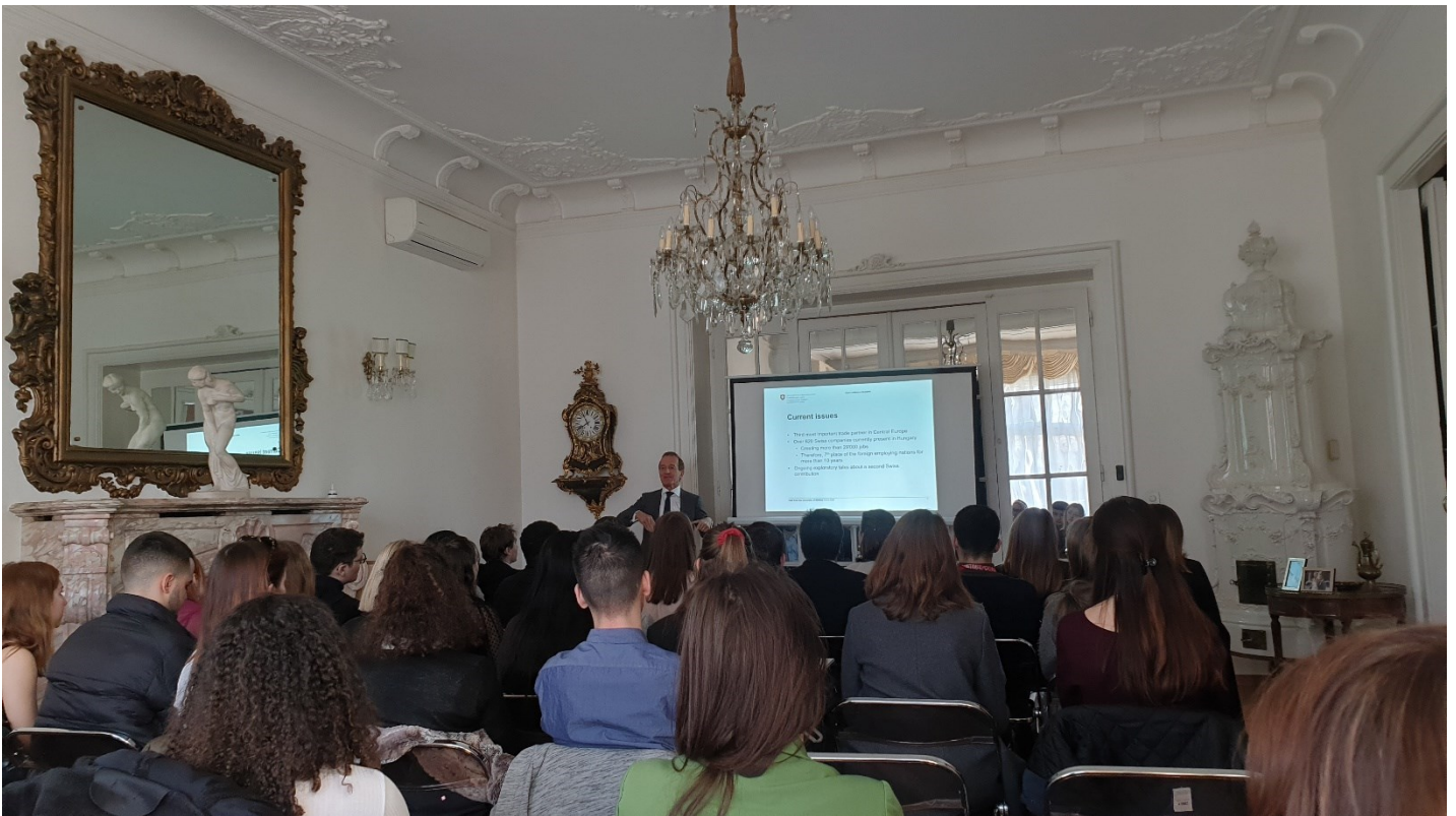
Botschafter Burkhard erzählt über die Beziehung zwischen Ungarn und der Schweiz

Beim anschliessenden Empfang in der Residenz hatten die jungen Studierenden genügend Zeit, bilateral alle Fragen zu stellen, welche ihnen noch auf der Zunge brannten. Sie haben dabei ihre Zeit in diesem ungewohnten Umfeld offensichtlich genossen.