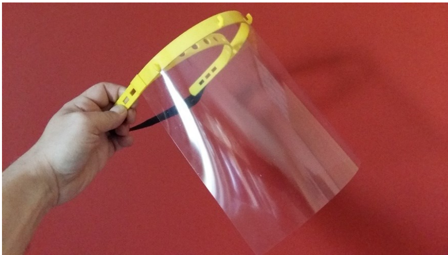
A Swiss Business Club védőpajzsa

A magyar kormány lényegbevágó intézkedéseket vezetett be 2020. március 11-én, amelyek elsősorban a lakosság védelmét célozták meg a COVID-19 járvány idején, de a gazdaságra is hatással voltak. A gazdaság egyes ágazatai jelentősen visszaestek, mások pedig átlag feletti keresletnek örülhettek. A svájci érdekeltségű magyarországi cégek tehát nagyon eltérő helyzettel szembesültek.