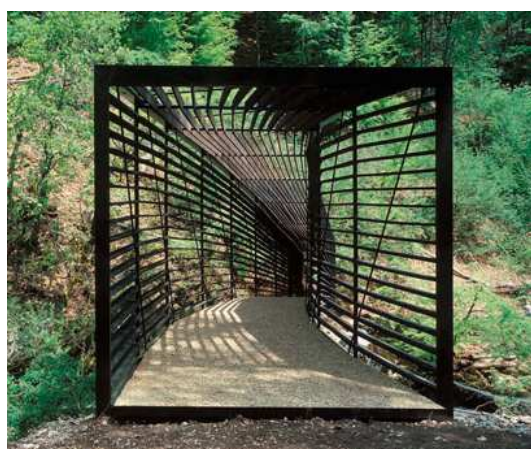
GeninascaDelefortrie, Footbridge, Boudry

Die Photoausstellung Swiss Positions, welche 33 Schweizer Architekturprojekte vorstellt, wird im Rahmen der Budapest Design Week im Oktober 2012 in der Galerie Ponton gezeigt.