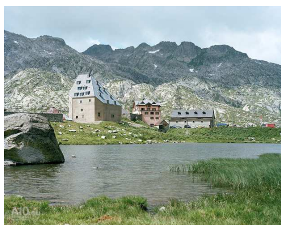
Miller & Maranta, St. Gotthard Hospice, St. Gotthard, 2009 © Ruedi Walti.