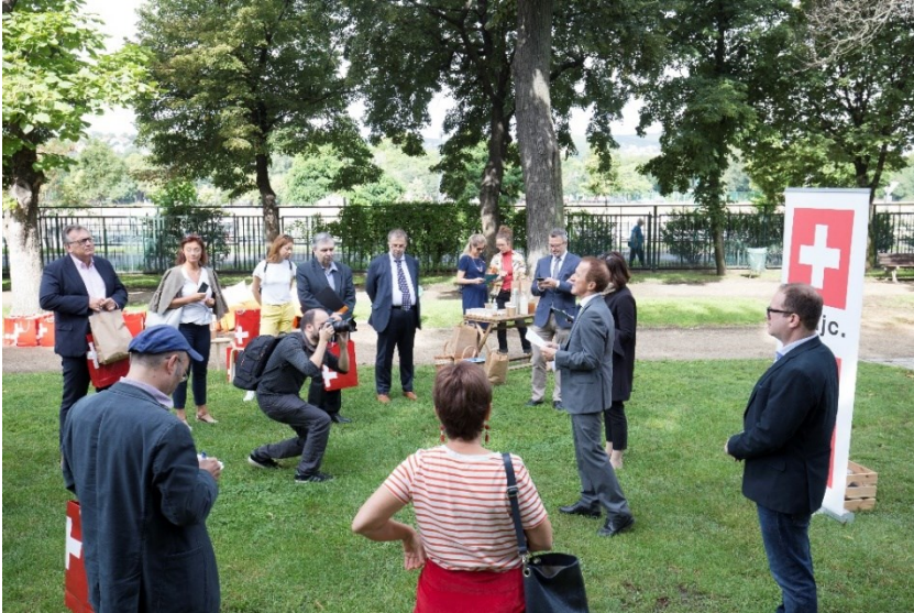
Presse-Picknick im Szent István Park / Foto: Dávid Harangozó

2020 begangen wir den 125. Geburtstag und den 45. Todestag des schweizerischen Diplomaten Carl Lutz (30. März 1895 - 12. Februar 1975). Zum Anlass dieses Jubiläumsjahres hat die Schweizerische Botschaft in Ungarn in Kooperation mit der Organisation Hosszúlépés. Járunk? thematische Stadtspaziergänge organisiert. Im Rahmen eines solchen Carl-Lutz-Spaziergangs konnten die wichtigsten Denkmäler, Orte und Häuser besichtigt werden, die an Carl Lutz erinnern. Als Kick-off-Event wurden Vertreter der Presse zu einem Picknick im Szent