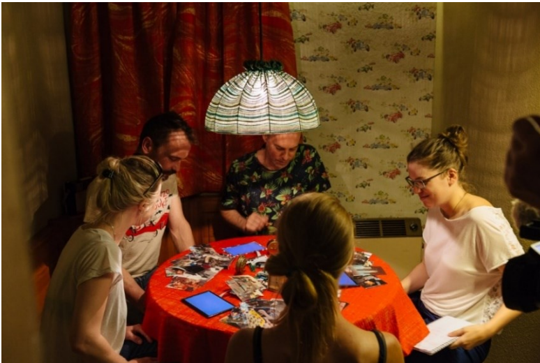
Nachlass - Pièces sans personnes

Die Aufführung «Nachlass» erwartete das Festivalpublikum in acht Räumen mit acht echten Geschichten. Im Zentrum einer jeden stand die Frage, was wir hinterlassen, wenn wir die irdische Welt einmal zurücklassen müssen.