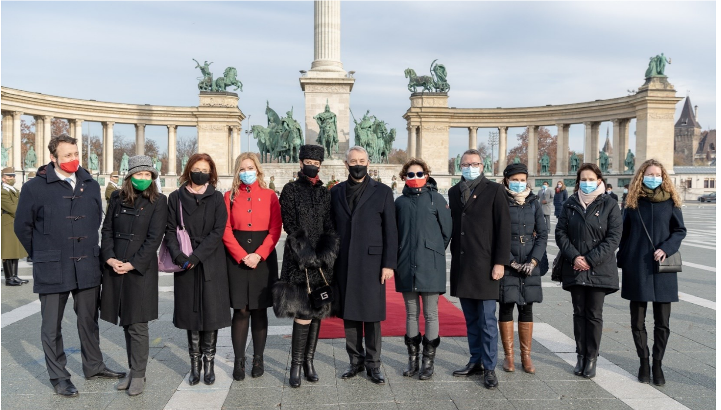
A nagykövet úr feleségével és a nagykövetség munkatársaival a Hősök terén

Jean-François Paroz új svájci nagykövet december 2-án nyújtotta át Áder János magyar köztársasági elnöknek megbízólevelét. A svájci kormány által aláírt okirat átadása a nagykövet missziójának formális megkezdését jelzi magyarországi rendkívüli és meghatalmazott nagykövetként. Paroz nagykövet úr számára ez már a második olyan alkalom, amikor a magyar köztársasági elnöknek nyújtja át megbízólevelét, ami a diplomáciában valamelyest szokatlan esemény. Az első átadási ünnepségen a nagykövet 8 évvel korábban első magyarországi hivatali ideje kezdetén vett részt.