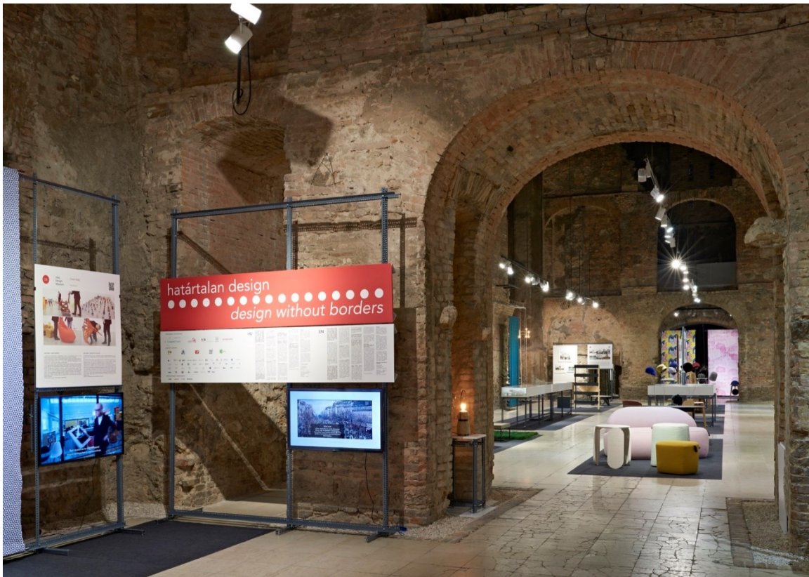
Határtalan Design a Kiscelli Múzeumban

Szintén fontos témái a kiállításnak a fenntartható fejlődés, valamint a környezettudatos és civil közösségek. A Határtalan Design / Design Without Borders egyfajta tervezői hálózatként, platformként is működik, amely a különböző generációk közötti párbeszédet teszi lehetővé.