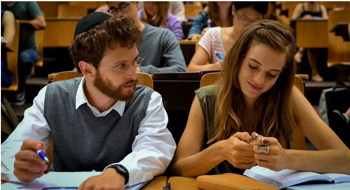
Szene aus dem Film Wolkenbruch

Haben Sie gemeint, es kann ein Jahr ohne Sehenswert vergehen? Keinesfalls! Filmliebhaber wissen es schon auswendig: Ende September, anfangs Oktober, ist die Zeit für Filme aus dem deutschsprachigen Raum gekommen. Auch dieses Jahr war es nicht anders. Am ersten Oktober wurde das Filmfestival Sehenswert im Kino Művész in Budapest mit dem deutschen Film «Berlin Alexanderplatz» eröffnet. Covidbedingt konnten wir weniger Filme zeigen, dafür haben wir die besten Filme aus Deutschland, Österreich und der Schweiz für die Zuschauer in die ungarischen Kinos gebracht. Mit der Organisation des Festivals haben wir natürlich schon im Frühjahr angefangen. Bei den online Vorbereitungsbesprechungen mussten wir viele Unsicherheiten aus dem Weg räumen. Soll es ein Live-Event sein oder sollen die Filme eher online gezeigt werden? Sollen wir ein passendes Gartenkino finden? Schlussendlich haben wir uns dafür entschieden, dass auf dem Lande alle Vorführungen in den Kinos stattfinden und in Budapest die Hälfte der Screenings im Kino Művész und die andere Hälfte online, im Fernkino. Rückblickend können wir sagen, dass es die richtige Entscheidung war und wir viele Leute erreichen konnten.