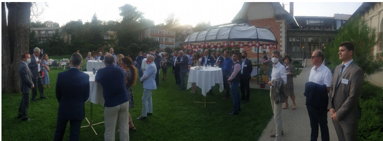
Die Swisscham verabschiedet sich von Botschafter Burkhard

Ein weiterer Open-Air-Anlass stellte schliesslich sicher, dass das Jubiläum nicht gänzlich der Pandemie zum Opfer fiel. Anlässlich ihres 25. Jubiläums stiftete Swisscham der ungarischen Hauptstadt 25 Bäume. Diese wurden am 3. November im Budapester Volkswaldchen eingepflanzt. Neben Gergely Karácsony, dem amtierenden Oberbürgermeister von Budapest, nahmen Mitglieder sowie Präsidium der Kammer und auch Vertreter der schweizerischen Botschaft an der Zeremonie teil.