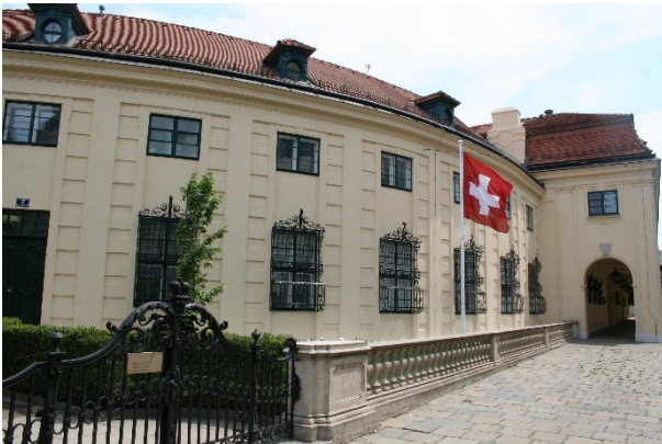
Regionales Konsularcenter in Wien

Über die Festtage, am 24./25.12. und 31.12./01.01. bleibt das RKC geschlossen.