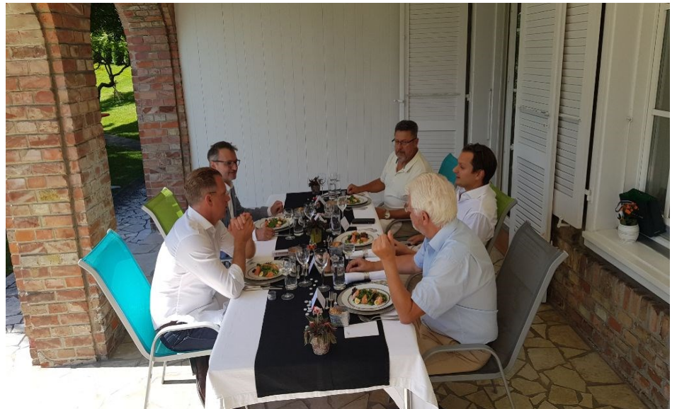
SBC-Vorstand bei István Kocsis

Bei Fragen und Interesse melden Sie sich einfach bei uns: info@swissbc.hu oder +36 30 929 5507 oder via Kontaktformular .