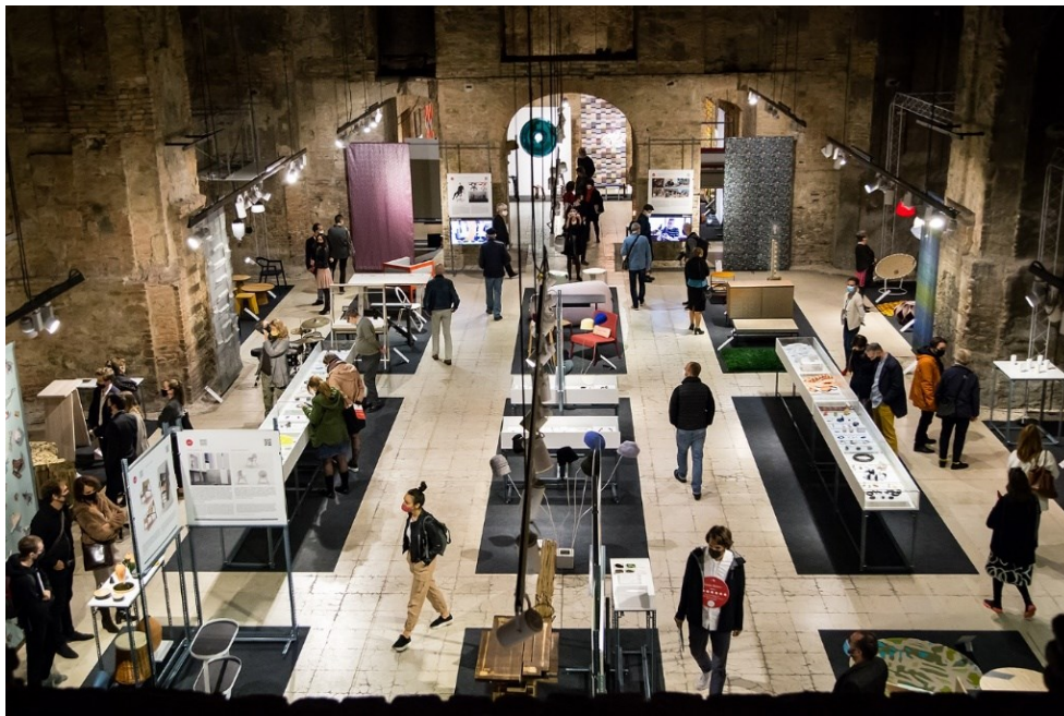
Design ohne Grenzen

Nachhaltige Entwicklung, eine umweltbewusste und zivilgesellschaftliche Gesellschaft sind wichtige Themen von Design ohne Grenzen, die auch als eine Art Designnetzwerk und -plattform fungiert, und so den Dialog zwischen verschiedenen Generationen möglich macht.