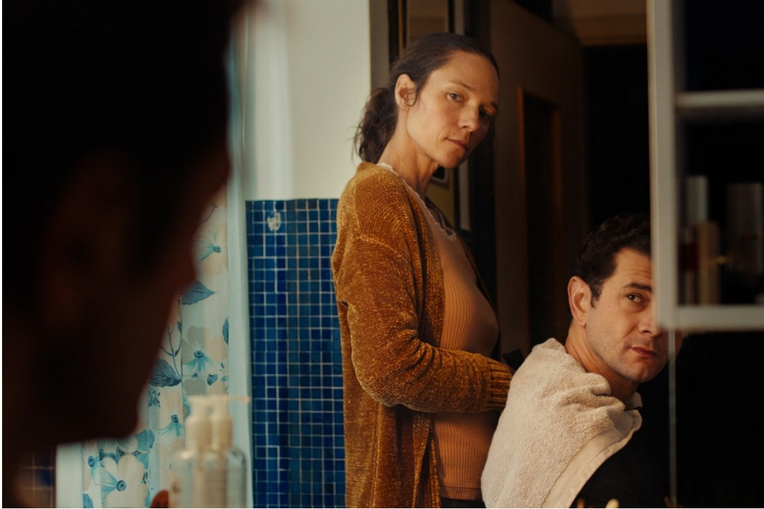
Jelenet az Időiszony című filmből

A MittelCinemaFest olasz nyelvű filmfesztiválnak a járvány miatt rövid határidőn belül át kellett költöznie az online térbe. Követségünk Francesco Rizzi Időiszony című filmjét mutatta be a filmhetek alatt, amely egy nő és egy férfi egyáltalán nem szokványos kapcsolatáról szól. Ezúton is szeretnénk köszönetet mondani a fesztivál fő szervezőjének, a budapesti Olasz Kulturális Intézetnek a kiváló együttműködésért.