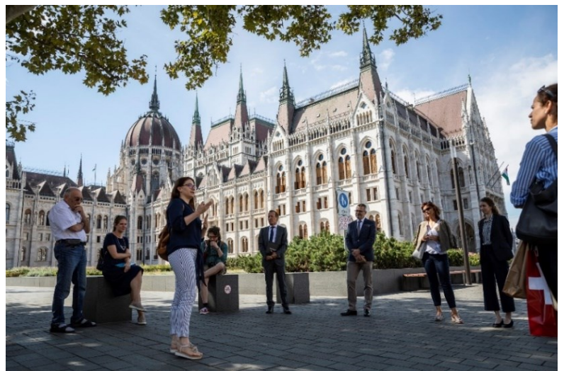
A Carl Lutz-emlékséta egyik állomása

A budapesti Svájci nagykövetség támogatásával további 4 ingyenes séta volt elérhető a szélesebb közönségnek.