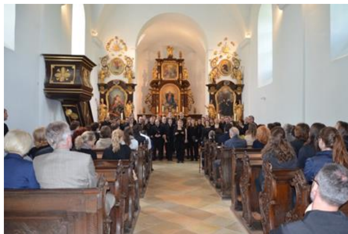
A Berni Egyetemi Kórus koncertje a pannonhalmi Mária-kápolnában

A Berni Egyetemi Kórus, illetve a Semmelweis Orvostudományi Egyetem zenekarának ezt követő koncertje hangulatosan zárta le az emlékünnepeket.