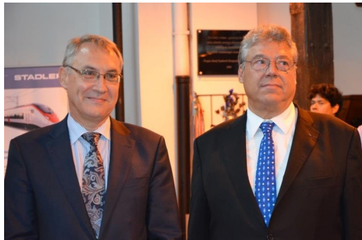
Filippo Lombardi felsőházi képviselő (jobbra) és Paroz nagykövet úr

Szentgotthárd és a tatai Svájci Sport- és Kalandnap után július 14-én, Budapesten került sor a „Gottardo 2016” című kiállítás ünnepélyes megnyitására. Szeptember 28-ig tekinthető meg a Ganz Ábrahám Múzeumban a Bem József u. 20. alatt.