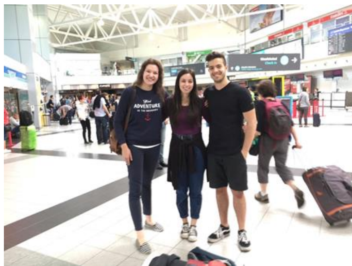
Az OIF-szimuláció három boldog győztese úton Genf felé

A szimulációt a Svájci Nagykövetség szervezte a Kölcsey Gimnáziummal, a magyarországi Francia Nagykövetséggel, a Francia Intézettel, valamint az OIF-fel együttműködve. A cél a képességek fejlesztése a retorika és a tárgyalási taktika terén, valamint a francia idegennyelvismeretek elmélyítése. Az idei fődíjat – háromnapos utazást Genfbe szállással együtt – a Kölcsey Gimnázium három diákja nyerte, akik teljesítményükkel teljes mértékben meg tudták győzni a zsűrit.