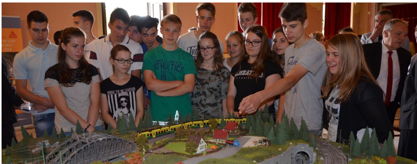
Egy szentgotthárdi iskola osztálya szemléli a Stadler Rail vasúti makettjét.