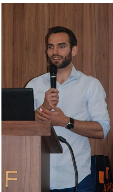
Szilágyi Áron, vívó olimpiai bajnok volt az idei díszvendég

Számos svájci vállalkozás értékes támogatásának köszönhetően sikerült megvalósítani ezt a sportos és társas rendezvényt. A „Svájci Sport- és Kalandnap” egyik díszvendége Szilágyi Áron, vívó olimpiai bajnok volt, aki 2015-ben Montreux-ben nyerte meg Európai bajnoki címét. A másik díszvendég Ferjancsik Domonkos, a VASAS vívószakosztályának elnöke, aki 1998-ban Svájcban, la Chaux-de-Fonds-ban lett világbajnok.