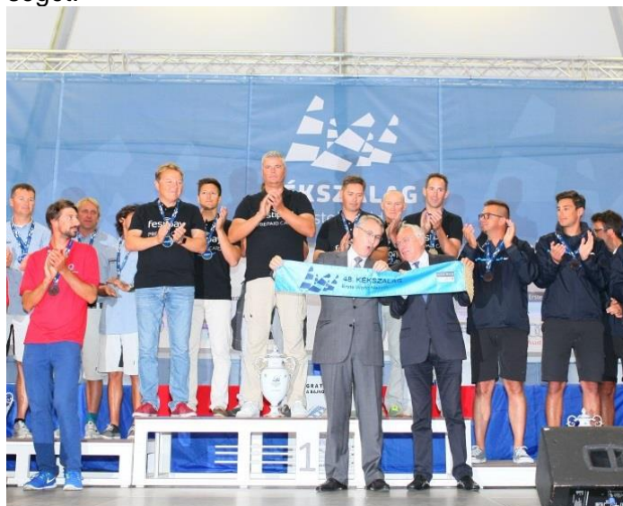
Paroz és Nagy nagykövet urak átadják a Kékszalagot a nyerteseknek

A Kékszalag alkalmából, mely július 14. és 16. között került megrendezésre a Balatonon, Magyarországra érkezett az a Svájci Alpesi Kürtakadémia. A két ország és tó partnerségének szép szimbólumaként a magyar nagykövet, Nagy István és Paroz nagykövet úr együtt nyújtották át a vitorlás verseny nyerteseinek a Kékszalagot. A kürtösök többek között a szigligeti várban, Ti-hanyban, a Szemesi és a Kékszalag-fesztiválon adtak koncertet. Július 19-én Laurent Wehrli, Montreux par-lamenti képviselője és polgármestere a Balatonnál tar-tózkodott, és találkozott a Balaton-Léman projekt ma-gyar partnereivel Balatonfüreden és Keszthelyen, ahol megismerhette a balatoni gasztronómia magas minő-ségét.