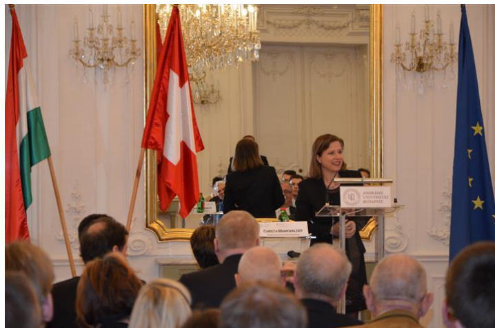
A nemzeti tanács elnök asszonyának előadása az Andrassy Egyetem tükörtermében

Budapesten, ahol érkezésük a legfontosabb svájci látogatásnak számított 2011 óta, a Nemzeti Tanács elnök asszonya találkozott többek között a Magyar Országgyűlés elnökével, a magyar köztársasági elnökkel, a nemzetgazdasági miniszterrel és a nemzeti erőforrások miniszterével. A küldöttségnek ezen felül lehetősége nyílt, hogy találkozzon a Parlament Magyar-Svájci Baráti Tagozatával.