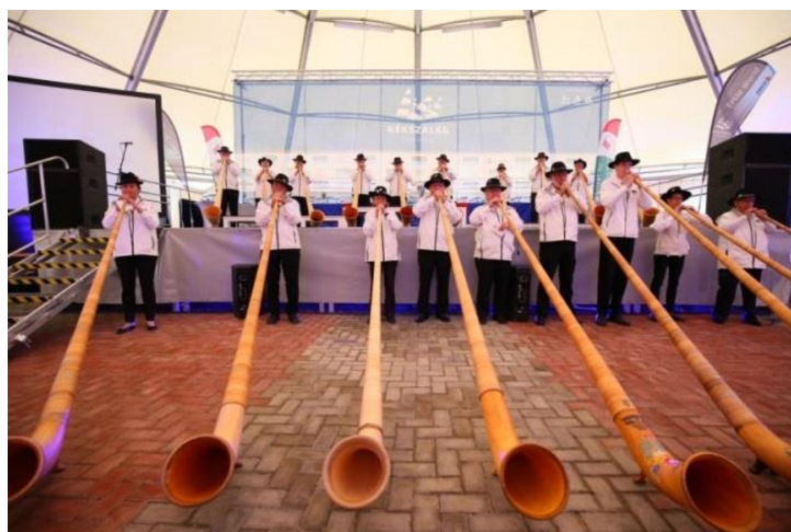
Az alpesi kürtösök a Kékszalag Fesztiválon

Idén májusban az École- Hôtelière de Lausanne (EHL) tett látogatást Magyarországon. A svájci fél mindeneke-lőtt hangot adott készségének, hogy több továbbkép-zési ösztöndíjat is felkínál a lausanne-i szálloda-szakiskolába és ezzel hozzájárul a Balaton térségének turisztikai támogatásához.