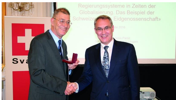
Masát rektor úr átadja Paroz nagykövet úrnak az Andrássy-emlékérmeket

Kiküldetésének ideje alatt Paroz nagykövet úr gyakran vendégeskedett az Andrássy Egyetemen, ahol számos előadást tartott Svájcról, Magyarországról és Európáról. Az Egyetemen tartott egyelőre utolsó előadásán, május 18-án egy szeminárium keretében erről a témáról beszélt: „A válság mint esély a megújulásra: a parlamentáris rendszerek reformkövetelményei és reformtapasztalatai a globalizáció korában.” Az előadás után Masát András, az Andrássy Egyetem rektora Andrássy-emlékérmeket adományozott Paroz nagykövet úrnak a budapesti küldetése alatt az egyetemért kifejtett fáradozásaiért.