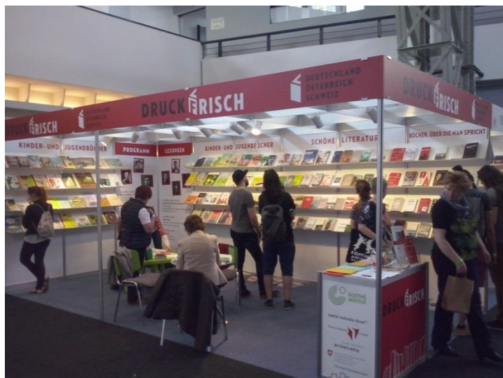
A német nyelvű stand a nemzetközi könyvfesztiválon

Alig száradt meg a nyomdafesték a német nyelvű stand könyveiben a 23. Nemzetközi Könyvfesztiválon, melyen a Millenáris fesztiváalterepe 2016. április 21. és 24. között az irodalom sétálóutcájává alakult, mely több mint 60 ezer látogatót vonzott. Az új német nyelvű irodalom választéka, melyet a Svájci Nagykövetség a Goethe Intézettel és az Osztrák Kulturális Fórummal együttműködve mutatott be a standon, a mesekönyvektől és verseskötetektől az elbeszélésekig és regényekig terjedt. Idén a gyermek- és ifjúsági irodalom volt a hangsúly, hogy főként az először olvasókat sikerüljön felkellesíteni a német nyelvű irodalom iránt. Hogy ez sikerült, azt látni lehetett a sok-sok lelkes gyereken, akik a gyerekasztalok körül tolongtak, kíváncsian lapozgatták az új könyveket vagy szorgosan részt vettek a kvízben.