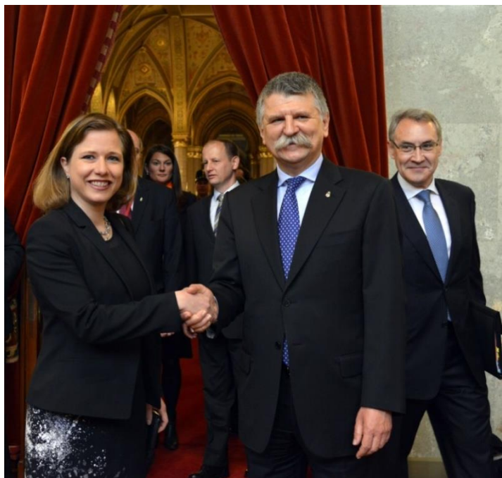
Christa Markwalder, a Nemzeti Tanács elnök asszonya Kövér Lászlóval, az Országgyűlés elnökével

Jól megmutatkozott a beszélgetések során, hogy mekkora jelentőséget tulajdonítanak a magyar hatóságok a befektetéseknek, valamint a magyarországi svájci vállalkozásoknak, melyek mintegy 39 ezer főt foglalkoztatnak. A Magyar Országgyűlés elnöke „nagyon fontos stratégiai partnernek” nevezte Svájcot. A 70 millió svájci frank összegű befektetés beharangozása a Nestlé részéről, melynek sajtótájékoztatóján Markwalder asszony és a magyar nemzetgazdasági miniszter is részt vett, nagymértékben hozzájárult, hogy feltáruljon a kétoldalú kapcsolatok gazdasági dimenziója.