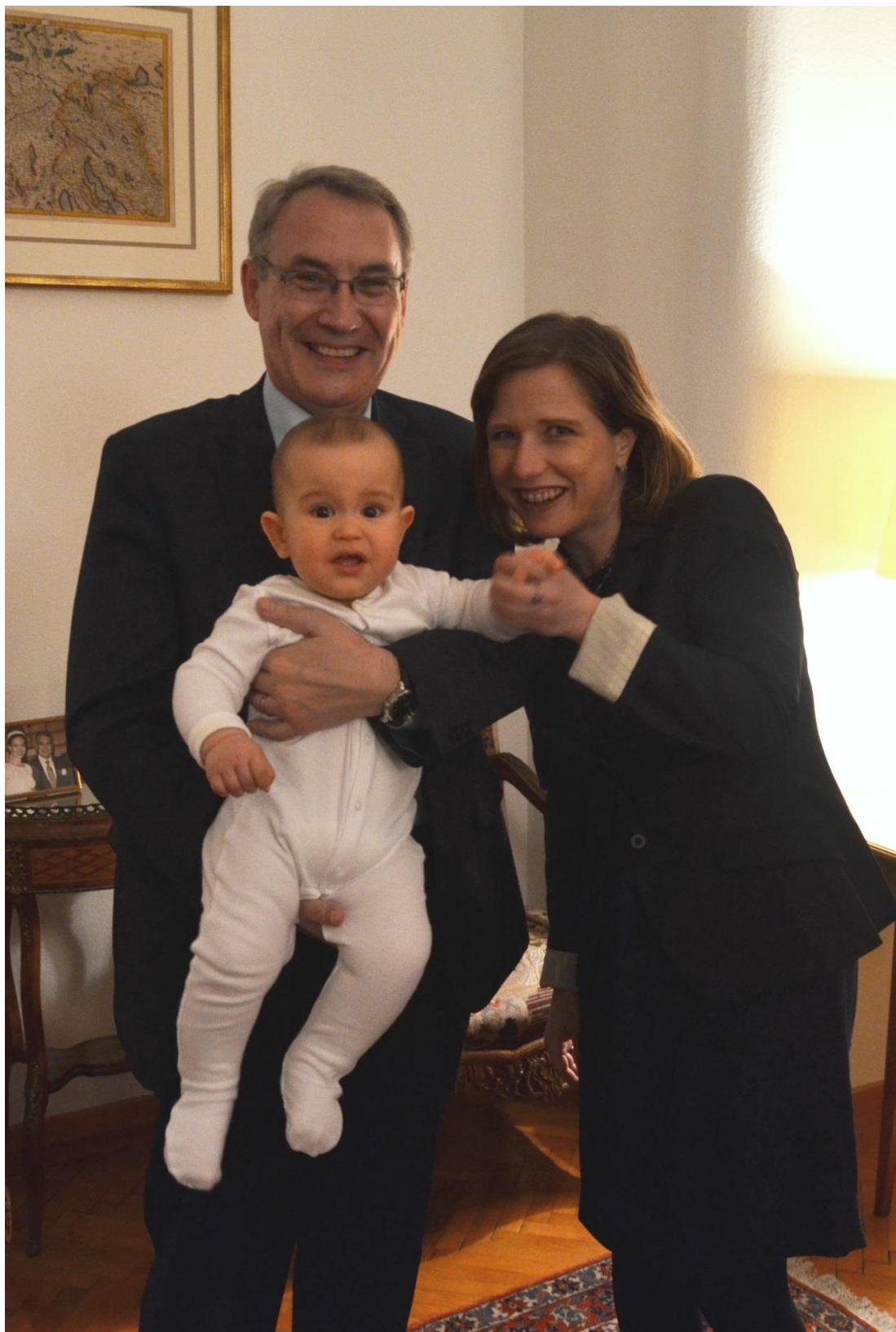
A Svájci Nagykövetségen Christa Markwalder egy külföldön élő ifjú svájccal találkozik