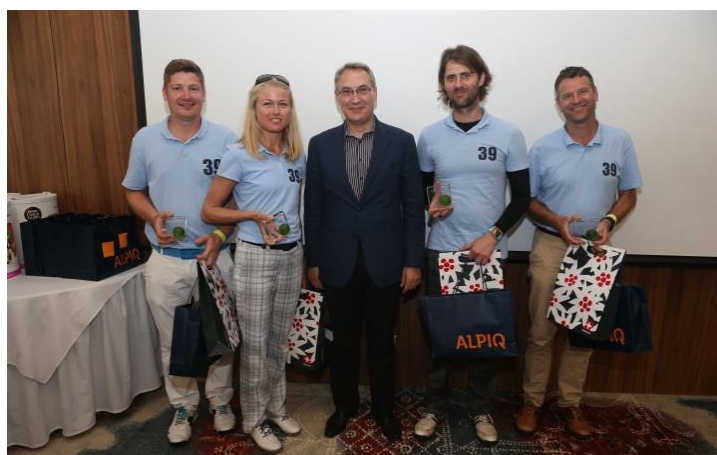
Paroz nagykövet úr a golfbajnokság boldog győztesével

Az egész napos rendezvény minden ízlés számára szolgált megfelelő programmal. A jelenlévőknek lehetőségük nyílt arra, hogy golf kocsikon fedezék fel a tájat és hivatásos edzők irányításával ismerkedjenek a golf sokrétű tudományával. A gyerekek szórakozását számos játék és gyermekprogram szolgáltatta. Az ambiciózus teniszezők bajnokságon indulhattak, melyen párosban állhattak ki egymás ellen. Délután a svájci nagykövet bemutatta a vendégeknek a nagykövetség egészéves programját, a „Grand Tour of Switzerland in Hungary”-t, valamint az interaktív térképet a nagykövetség honlapján.