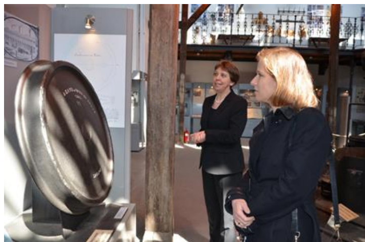
Christa Markwalder, a Nemzeti Tanács elnök asszonya a Ganz Öntödei Gyűjteményben

A Nagykövetség honlapján, interaktív térképen vannak feltüntetve olyan helységek és nevezetességek, melyek történelmi események, híres személyiségek, testvérvárosi kapcsolatok révén vagy vállalati telephelyként különleges kapcsolatba állnak Svájjal. A látogatók a térkép segítségével megtudhatják, hogy Magyarországon hol léteznek svájci kapcsolatok. De nem csak az interaktív térkép, hanem a számos esemény is, melyeket partnereinkkel szerveztünk és bonyolítottunk le, és mindaz, ami még hátra van, egyedülállóvá teszi a „Grand Tour” projektjét.