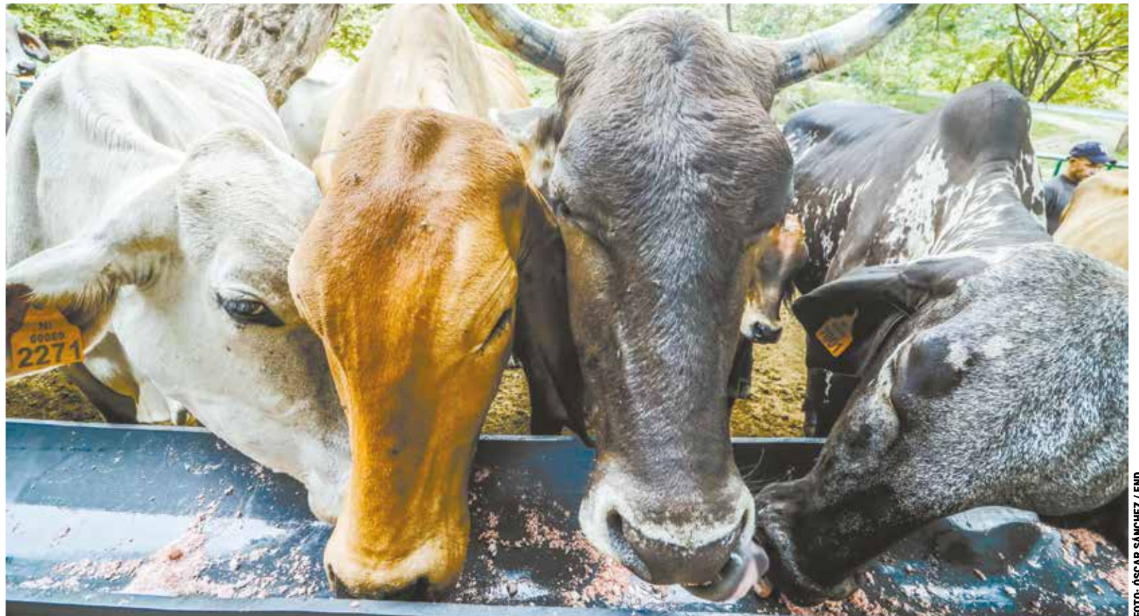
El Programa de Gestión Comunitaria de la Cuenca del Río Dipilto ha puesto en práctica el sistema silvopastoril, con el objetivo de tecnificar las fincas ganaderas, para transformar un sistema tradicional extensivo en un sistema intensivo.

“Con el proyecto estamos estableciendo un sistema silvopastoril en donde nos han apoyado con