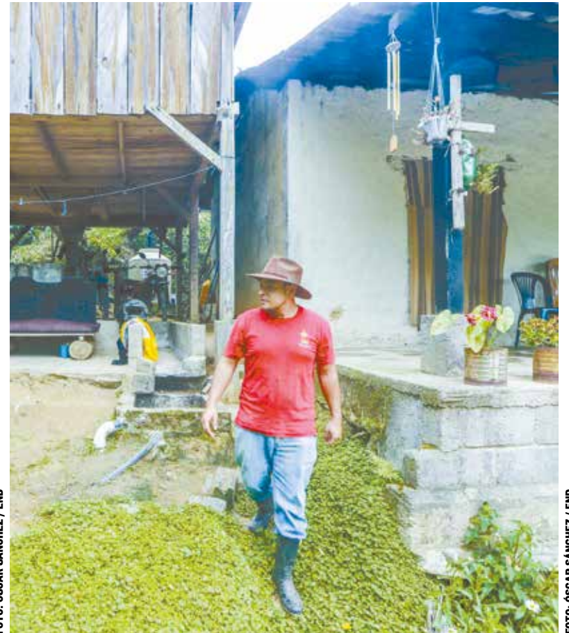
Finca San José.

mayor parte de Lombrihumus y se revuelve con pulpa de café. El Lombrihumus se vende, se aplica como abono al llenado de la bolsa y al momento de trasplante al suelo”, compartió.