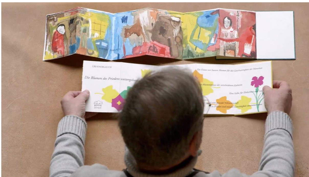
Кадр из фильма «Река всегда права / Il fiume ha sempre ragione»

Региональная италяязычная кинопрограмма после Таганрога отправится в Томск – там, в Томском филиале Государственного Центра Современного Искусства будут показаны 5 фильмов: «Синестезия», «В свободном падении», «То, что остаётся», «Река всегда права» и «Хлеб и тюльпаны».