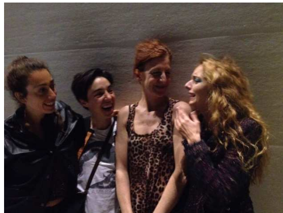
La Ribot und Co.

Du 2 au 12 octobre l'hôte du festival „Cité des femmes“ à Ljubljana était l'artiste La Ribot de Genève. Sa performance Laughing Hole de 6 heures a clos ce festival exceptionnel qui cette année s'est attribué le slogan « Tactiques de survie ». A la réception qui clôturait le festival nous avons, en rapport à ce slogan, proposé aux hôtes une soupe de châtaignes puisque en Suisse la châtaigne représentait parfois « l'arbre à pain ».