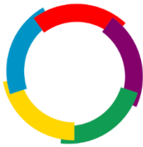
Drapeau de la francophonie

Ende März war die Schweizerische Botschaft in Slowenien bereits schon das siebte Mal am Festival des Frankofonen Filmes beteiligt, an welchem diesmal Filme aus Ägypten, Albanien, Belgien, Bulgarien, Frankreich, Kanada, Kroatien, Österreich, Rumänien, der Schweiz und Slowenien gezeigt wurden.