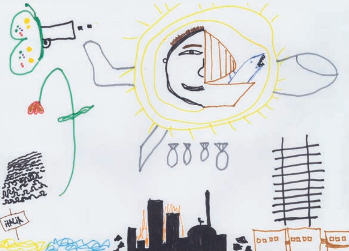
Zeichnung eines syrischen Flüchtlingskindes © Save the Children