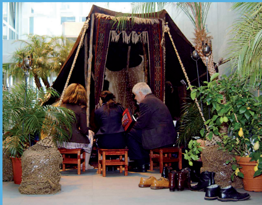
«Tente de storytelling» mise en place à l'occasion du colloque Dare to Share Fair (2004). Les visiteurs étaient invités à retirer leurs chaussures avant d'entrer en étrangers et de ressortir en amis.

Le fait de recourir au récit et de raconter une histoire («story telling») nous incite à communiquer les uns avec les autres. Des histoires simples peuvent éclairer des réalités complexes et révéler des vérités profondes; à cet égard, la force évocatrice du détail ne saurait être sous-estimée. Le fait de raconter une histoire – et d'être entendu et compris d'autres personnes – permet d'acquérir une certaine assurance. L'adjonction d'éléments narratifs dans des rapports plus traditionnels attire l'attention du lecteur tout en signalant clairement l'importance accordée à l'alternance des voix et perspectives.