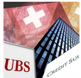
Nach den bei der CS-Notffusion angeordneten AT1-Abschreibungen häufen sich Klagen gegen die Finma und die Schweiz.