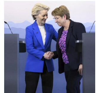
EU-Kommissionspräsidentin Ursula von der Leyen und Bundespräsidentin Viola Amherd bei der Medienkonferenz in Bern am 20. Dezember 2024.