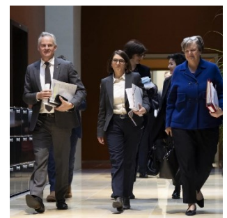
Die Mitglieder der PUK stellen im Bundeshaus ihren Abschlussbericht zur Credit Suisse vor.