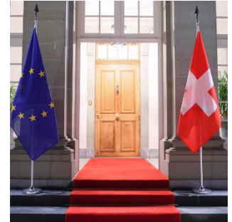
Die Flaggen der Schweiz und der EU auf dem Landgut Lohn in Kehrsatz anlässlich der abgeschlossenen Verhandlungen zwischen der Schweiz und der EU.

bezeichnet. In den Nachbarländern stellen mehrere Beiträge das Ergebnis als vorteilhaft und als eine Chance für die Schweiz dar, auch weil die EU in zentralen Bereichen wie Zuwanderung und Forschung Zugeständnisse gemacht habe. Zugleich wird darauf hingewiesen, dass das Abkommen noch ratifiziert werden müsse. Vor diesem Hintergrund beleuchten zahlreiche Medien die innenpolitische Ausgangslage in der Schweiz und die Argumente der heterogenen Gegnerschaft des Abkommens. Einer möglichen Volksabstimmung in der Schweiz blicken sie eher pessimistisch entgegen: Aufgrund des weit verbreiteten EU-Skeptizismus in der Schweiz sei es fraglich, ob das Abkommen bei einer Abstimmung tatsächlich Zustimmung finden werde, so der Tenor.