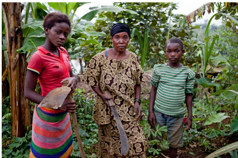
Le statut de la femme est l'un des thèmes abordés dans les ateliers de sensibilisation.