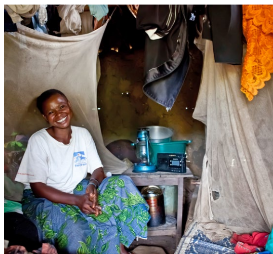
Bénéficiaire du programme psychosocial dans la région des Grands Lacs.

Les conflits successifs qui ont touché la région des Grands Lacs (Burundi, Rwanda et République démocratique du Congo) dans les années 1990 ont laissé une population traumatisée. Les femmes et les jeunes filles en particulier ont été, et sont encore les premières victimes de violences sexuelles et basées sur le genre. La DDC finance au Sud-Kivu, ainsi qu'au Burundi et au Rwanda voisins, un programme de prise en charge intégrée des victimes. Depuis 2011, environ 20'000 personnes en ont bénéficié.