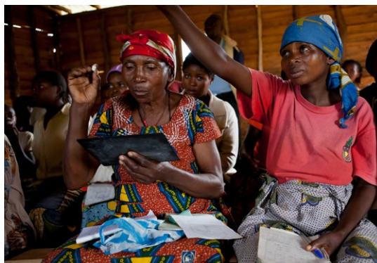
Les femmes apprennent à lire et à écrire et sont informées sur leurs droits.

Les dimensions médicale, psychosociale et intégration des victimes sont prises en charge par la DDC. Une réponse durable aux violences sexuelles et aux violences basées sur le genre dans la région des Grands Lacs passera non seulement par un travail au niveau communautaire (y inclus avec les hommes) et par un renforcement du système de santé, mais aussi, et surtout, par un engagement politique ferme des Etats concernés à lutter contre l'impunité en poursuivant de manière systématique les auteurs de ces crimes.