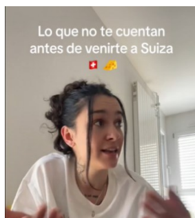
heidjinx raconte sur TikTok les défis inattendus qu'elle a rencontrés en Suisse.

La Suisse est une terre d'immigration prisée, surtout pour les ressortissants des pays voisins et d'Europe du Sud. Dans les médias européens, cette réalité se reflète depuis peu à travers divers témoignages de personnes ayant immigré en Suisse. Les articles se fondent souvent sur des billets publiés sur les médias