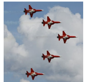
Des avions de la Patrouille suisse illustrent un article sur le rapprochement avec l'UE et l'OTAN recommandé par la Commission d'étude sur la politique de sécurité.