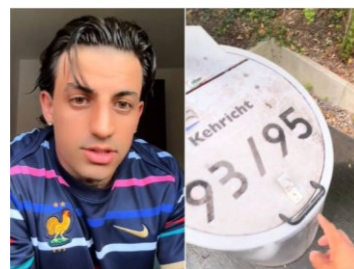
Sur le compte TikTok suiza.en.español , un Espagnol explique à quel point la réglementation suisse en matière d'élimination des déchets peut être stricte et coûteuse. (@ El Confidencial )

sociaux, où de tels témoignages rencontrent un large écho. On a ainsi vu fleurir sur TikTok les récits insolites d'Espagnols vivant en Suisse, repris ensuite par plusieurs médias espagnols de référence. Le contenu de ces billets va de conseils concrets à l'intention des nouveaux arrivants à des explications factuelles sur le quotidien en Suisse. Dans certains cas, des particularités sociales telles que les préjugés à l'égard de différents groupes de migrants, sont aussi abordées de manière critique. La publication de vidéos sur TikTok ou Instagram se prête particulièrement bien à la diffusion d'expériences personnelles, en rendant ces contributions vivantes et réalistes. Reprises par les médias écrits, elles contribuent d'une manière non négligeable à façonner l'image de la Suisse à l'étranger.