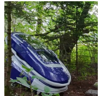
La capsule d'aide au suicide Sarco dans une forêt suisse, où elle a été utilisée pour la première fois en septembre.