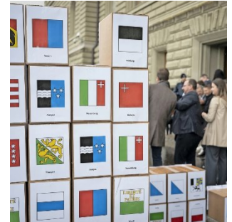
Signatures récoltées pour l'initiative populaire « Oui à des rentes AVS équitables pour les couples mariés », déposée le 27 mars 2024.

pour des initiatives populaires en Suisse. Ils relèvent le caractère unique du système politique suisse, perçu comme globalement positif, tout en pointant de possibles faiblesses.