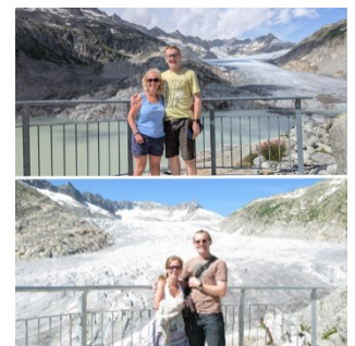
Deux photos prises par un à 15 ans d'intervalle, témoignent du recul spectaculaire du glacier du Rhône et sont devenues virales sur les médias sociaux.