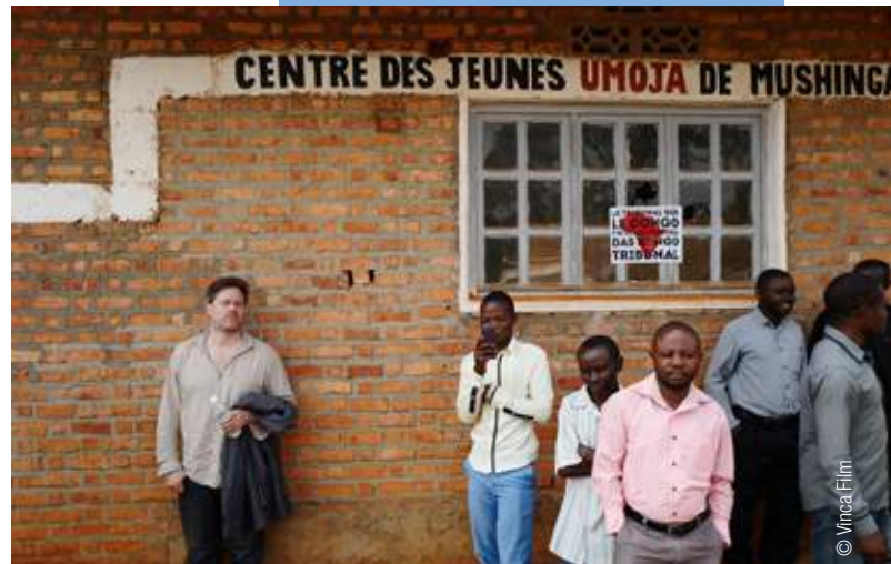
Milo Rau au village Mushinga, Kivu Sud à l'occasion de la présentation du film, juillet 2017.

Infos: www.the-congo-tribunal.com www.y-en-a.com / www.vuesdafrique.com