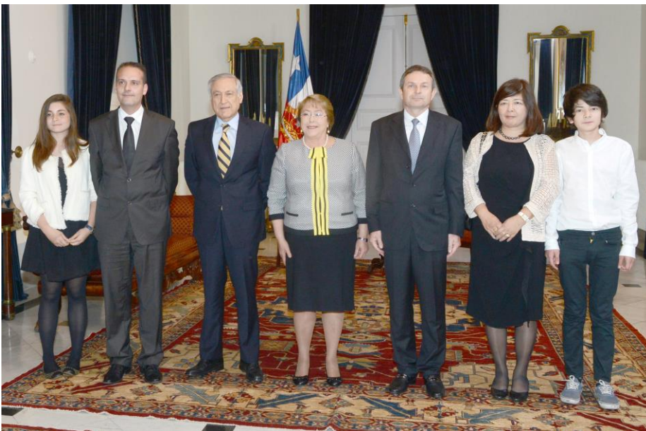
El Embajador, su esposa, sus hijos y el Primer Secretario con la Presidenta y el Ministro de Relaciones Exteriores de Chile