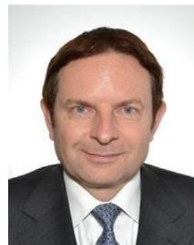
Embajador Edgar Dörig