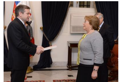
El Embajador presentando sus cartas credenciales a la Presidenta de Chile