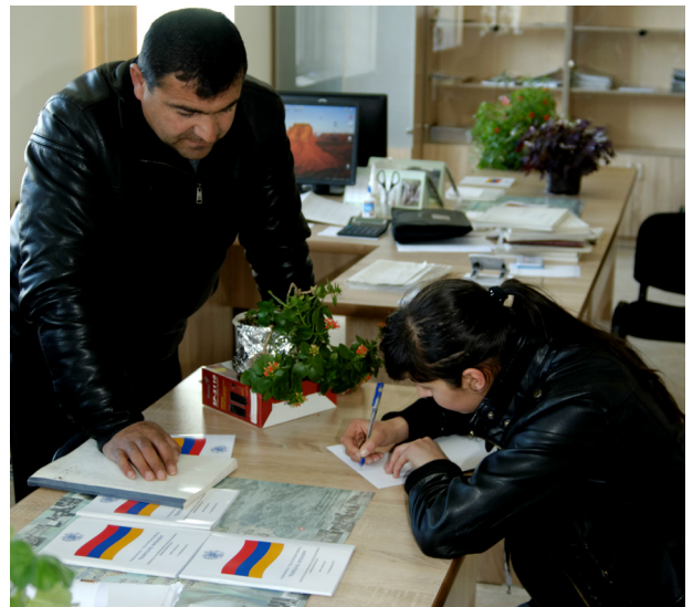
„ერთი ფანჯრის პრინციპი“ ერთი ადგილია, სადაც მრავალი სერვისია ხელმისაწვდომი. სომხეთის ბევრ მხარეში მოქალაქეებს ერთ ჭერქვეშ შეუძლიათ ქონების გადასახადის გადახდა, ნებართვებისა თუ ლიცენზიების მიღება, მუნიციპალიტეტის თანამშრომლებთან შეხვედრა.