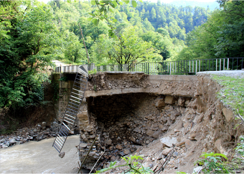
აჭარაში მდებარე ეს ხიდი წყალდიდობამ დააზიანა. წყალდიდობა და მსგავსი ბუნებრივი კატასტროფები ვნებს ადგილობრივ ინფრასტრუქტურას, სოფლებს წყვეტს ბაზრიდან და ანადგურებს ველ-მინდვრებს. მდინარის სიახლოვეს მდებარე ფერმერული მეურნეობების დასაცავად შესაბამისი დამცავი ღონისძიებები ტარდება.

მიუხედავად იმისა, რომ მოუგვარებელი კონფლიქტები და მხარეებს შორის გაჩენილი უნდობლობა გარკვეულწილად ზღუდავს რეგიონულ თანამშრომლობას, როგორც ადგილობრივი, ისე საერთაშორისო აქტორები თანხმდებიან, რომ რეგიონში არსებული გამოწვევების დიდ ნაწილთან გამკლავება მხოლოდ თანამშრომლობის გზითაა შესაძლებელი. ამგვარი რეგიონული მიდგომის ჩამოყალიბება შესაძლებელია როგორც თანამშრომლობის არსებული მექანიზმების (მაგ., ვაჭრობის, ტრანსპორტისა თუ ენერგეტიკის სექტორებში), ასევე, სხვადასხვა სფეროში (მაგ., მდგრადი სამთო განვითარება და გენდერული თანასწორობა) არსებული აკადემიური თუ პროფესიული კავშირების დახმარებით.