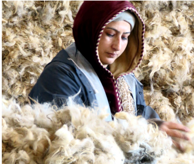
ადგილობრივი ფერმერებისათვის მატყლს აქვს მნიშვნელოვანი საექსპორტო პოტენციალი.

მესამე - SDC-სთან ერთად SECO ხელს შეუწყობს ბიზნესგარემოს გაძლიერებას და დაფინანსების წვდომას იმ მცირე და საშუალო ბიზნესისათვის (მათ შორის სოფელში), რომლებსაც ზრდის მნიშვნელოვანი პოტენციალი აქვთ. ამ მიზნით ძალისხმევა მიმართული იქნება სასოფლო-სამეურნეო და კერძო სექტორის პოლიტიკაზე, სტანდარტების დადგენასა და განხორციელებაზე, ასევე, (სოფლად) მცირე და საშუალო საწარმოებისათვის დაფინანსების, ცოდნისა და ფინანსური განათლების მიღებაზე. SECO უფრო ღრმად ჩაერთვება ფინანსური ინფრასტრუქტურის განვითარებისა და დივერსიფიკაციის სფეროში, მაგ., მობილური გადახდებისა და საბანკო მომსახურების განვითარებისა თუ ქალებისათვის ფინანსურ მომსახურებაზე წვდომის გაზრდის მხარდაჭერაზე. გარდა ამისა, კერძო სექტორი მიიღებს დახმარებას, რომ აქტიურად დაიცვას ეკონომიკური საქმიანობის იურიდიული და ინსტიტუციური ჩარჩოს სანდოობა.