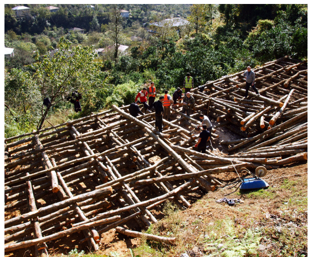
აჭარის სოფ. ჯოყოში ხის ჯებირები აიგო, რათა მოსახლეობას უსაფრთხოდ გავლის საშუალება ჰქონდეს. აქამდე ამ მეწყერსაშიშო ზონის მაცხოვრებლებს ვიწრო, დაუგებელი გზით უწევდათ გადაადგილება.