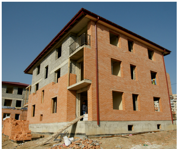
საქართველოში აშენდა სოციალური საცხოვრისები, რათა ყველაზე დაუცველმა მოსახლეობამ გაიუმჯობესოს საცხოვრებელი პირობები.

აზერბაიჯანში სამოქალაქო საზოგადოებასთან დაკავშირებით ვითარების გაუარესებამ შეაფერხა მნიშვნელოვანი წინსვლა ადამიანის უფლებებსა და დემოკრატიულ პროცესებში. აღსანიშნავია წინსვლა აზერბაიჯანში საჯარო ფინანსების მართვის სფეროში. შვეიცარიის დახმარებით გაძლიერდა გარე აუდიტის სისტემა - უფრო დივერსიფიცირებული გახდა გამოყენებული აუდიტის ტიპები და გაუმჯობესდა მისი მართვის ეფექტიანობა. ამოქმედდა გამართული ელექტრონული რეგისტრაციის პლატფორმა, რამაც გააუმჯობესა საკადასტრო და უძრავი ქონების რეგისტრაციის პროცესი.