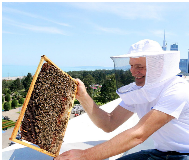
მაღალმთიანი აჭარიდან ფუტკარი ბათუმის (საქართველო) სასტუმროების ტერასებზე „დასახლდა“ და სტუმრებს თავლით უზრუნველყოფს.