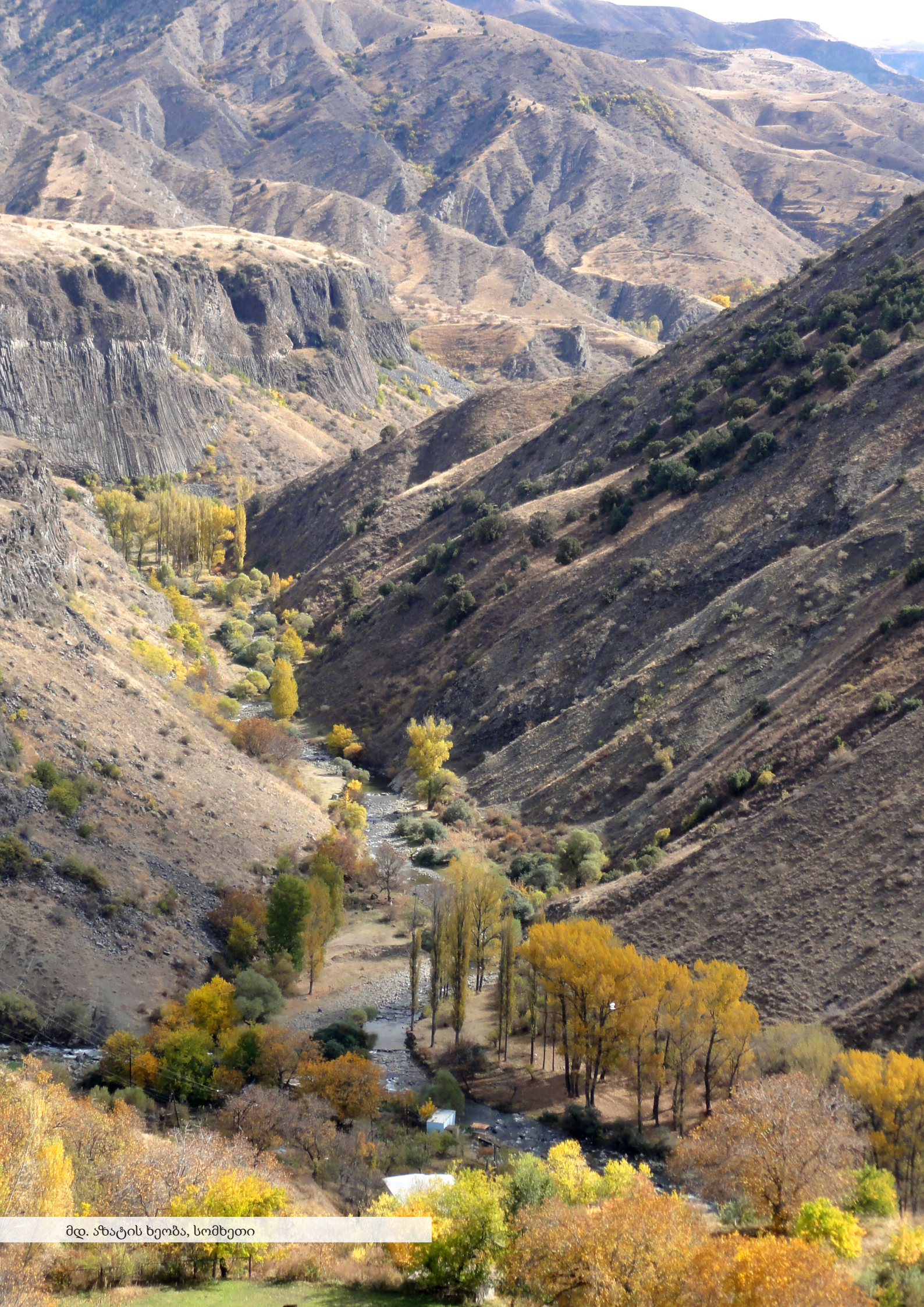
მდ. ახატის ხეობა, სომხეთი