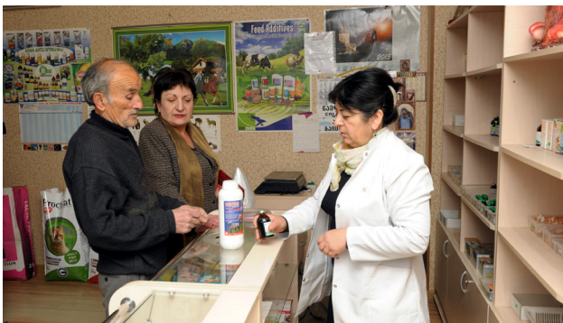
ვეტერინარიული აფთიაქები კარგადაა აღჭურვილი და დიდ დახმარებას უწევს ადგილობრივ ფერმერებს სხვადასხვა საქმიანობაში.