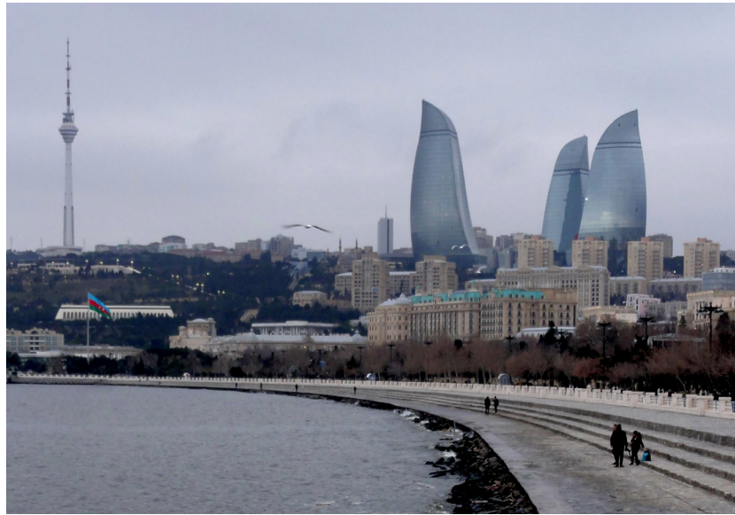
... და ასევე ქალაქები, როგორიცაა ბაქო - აზერბაიჯანის დედაქალაქი.

აღმასრულებელი და საკანონმდებლო ორგანოებისათვის აუცილებელია შემდგომი ინსტიტუციური განვითარება, რაც შეამცირებს ძალაუფლებისათვის ბრძოლის გავლენას და პოპულისტი კანონმდებლების რისკს. აუცილებელია გადამჭრელი ზომების მიღება კარგი მმართველობის, კანონის უზენაესობის, ძალთა გადანაწილებისა და გამჭვირვალობის უზრუნველსაყოფად. პოლიტიკური ლიდერებისა და შეზღუდული ეკონომიკური შესაძლებლობების მქონე მართ ხალხის მზარდი უკმაყოფილება რამდენჯერმე პროტესტშიც კი გადაიზარდა. მიუხედავად ამისა, სამოქალაქო ჩართულობა კვლავაც ძალიან დაბალია და პოლიტიკური ელიტაც მინიმალურად შეიცვალა. მართალია, საქართველოსა და სომხეთში არიან აქტიური სამოქალაქო ჯგუფები, მაგრამ მათი ინტერაქცია მმართველობის ორგანოებთან გა-