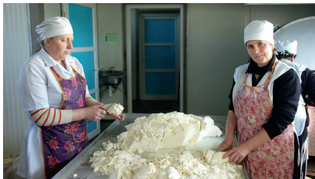
რძის ტექნოლოგიების, სურსათის უვნებლობის, ბიზნესისა თუ მარკეტინგის შესახებ ცოდნის გაუმჯობესებით საწარმოებმა წარმატება გაიორმაგეს.

შვეიცარიის ძალისხმევით მოხდა აზერბაიჯანის ფინანსური სექტორის მოდერნიზაცია და დივერსიფიკაცია. ახალი ელექტრონული მომსახურების შემოღებამ, მაგ., ბიზნესის ონლაინ რეგისტრაციამ, მნიშვნელოვნად შეამცირა ხარჯები (წელიწადში 13 მლნ. აშშ დოლარი). ეროვნულმა საფოსტო სამსახურმა „აზერპოსტმა“ მნიშვნელოვნად გაზარდა სოფლის მოსახლეობის წვდომა ფინანსებსა და მომსახურებაზე ისეთი ახალი სერვისების შეთავაზებით, როგორიცაა ფულადი გზავნილები და ფულის გადარიცხვა, ვალუტის გაცვლა და სადებეტო ბარათების გაცემა.