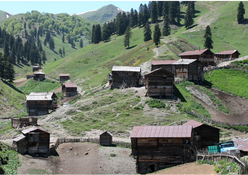
სამხრეთ კავკასიის ლანდშაფტი მრავალფეროვანია და ხშირია ისეთი იზოლირებული ადგილები, როგორიც ეს აჭარული სოფელია...

სამხრეთი კავკასია, რომელიც შავი და კასპიის ზღვებს შორის მდებარეობს და რუსეთს, თურქეთს, ირანსა და ევროპას ესაზღვრება, ყოველთვის იყო მნიშვნელოვანი გეოპოლიტიკური, სტრატეგიული ინტერესებისა და ეკონომიკური ღირებულების მქონე რეგიონი. მიუხედავად იმისა, რომ სამხრეთ კავკასიის ქვეყნები სხვადასხვა კულტურისა თუ კლიმატის გავლენას განიცდიან და საგარეო პოლიტიკის განსხვავებული მიმართულებები აქვთ, მაინც ბევრი საერთო გამოწვევის წინაშე დგანან. საბჭოთა კავშირის დაშლის შემდეგ სამივე ქვეყანამ ერთნაირი სირთულეები გამოიარა, განსაკუთრებით, საბაზრო ეკონომიკასა და დემოკრატიაზე გადასვლის თვალსაზრისით, ჰქონდათ სერიოზული და ქრონიკული ნაკლოვანებები ეკონომიკურ და სოციალურ განვითარებაში, ტერიტორიული კონფლიქტები და უმცირესობებთან დაკავშირებული პრობლემები. დამოუკიდებლობიდან 25 წლის შემდეგ სამივე ქვეყანას ესაჭიროება რუსეთთან არსებული კავშირებისა და ურთიერთობების შეცვლა.