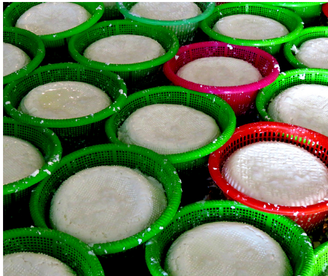
რძის პროდუქტების მცირე საწარმოებმა ადგილობრივი ბაზრისათვის მაგარი ყველის ახალი სახეობების შემატებით გაზარდეს და გაამრავალფეროვნეს ყველის წარმოება.