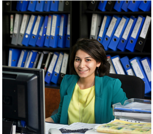
საჯარო ფინანსების უკეთესი მართვა ხელს შეუწყობს აზერბაიჯანში უფრო ეფექტური და ანგარიშვალდებული სახელმწიფო ინსტიტუტების ჩამოყალიბებას.

ძირითადად HSD-ის პროგრამის ფარგლებში და SDC-ის შესაძლო ჩართვით აფხაზეთის ეკონომიკურ განვითარებაში გაგრძელდება დიალოგი, ნდობისა და კავშირების აღდგენა, ასევე კონფლიქტების მოგვარების პოლიტიკური გზების მოძიების ღონისძიებები.