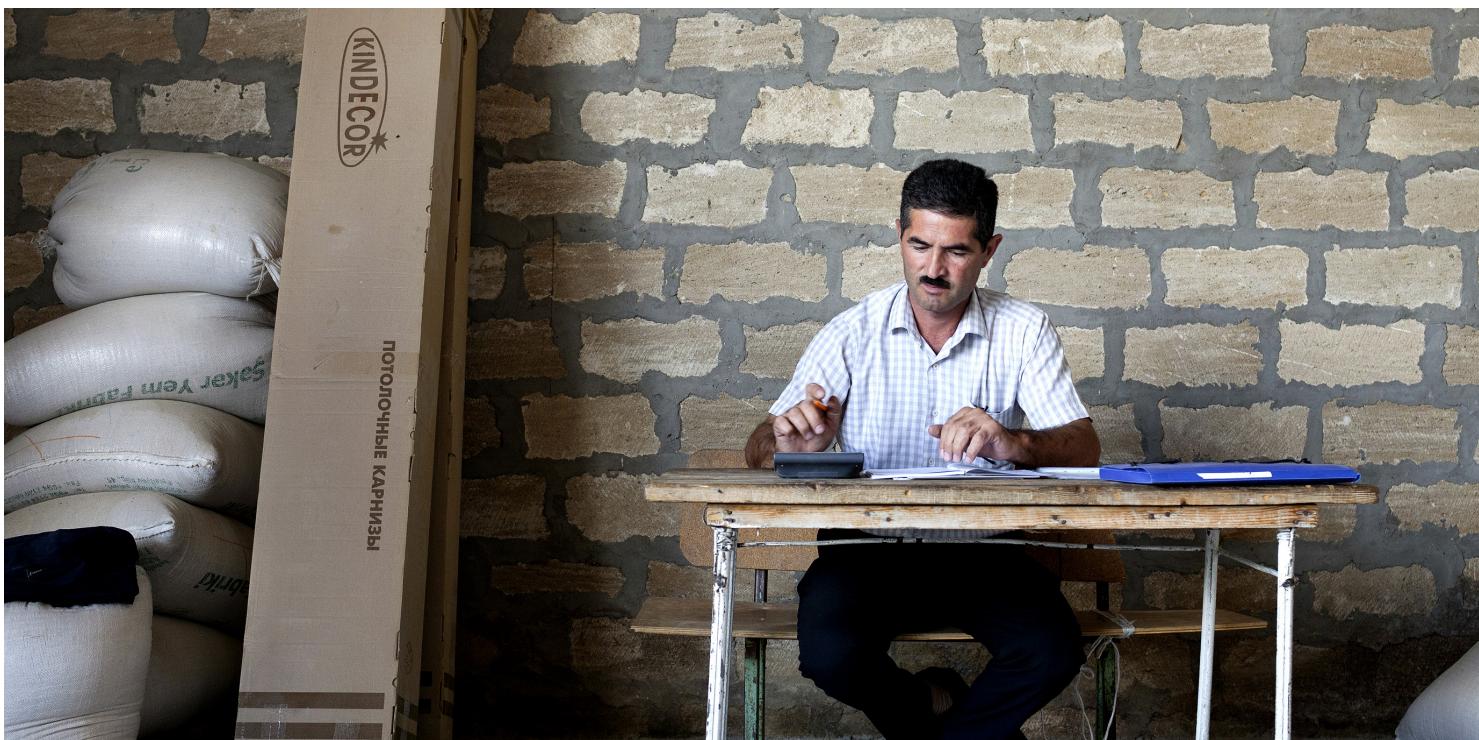
კრედიტებზე წვდომა წარმმართველი ფაქტორია კერძო სექტორის, მათ შორის, სოფლისა და თვითდასაქმებული ოჯახების განვითარებისათვის.