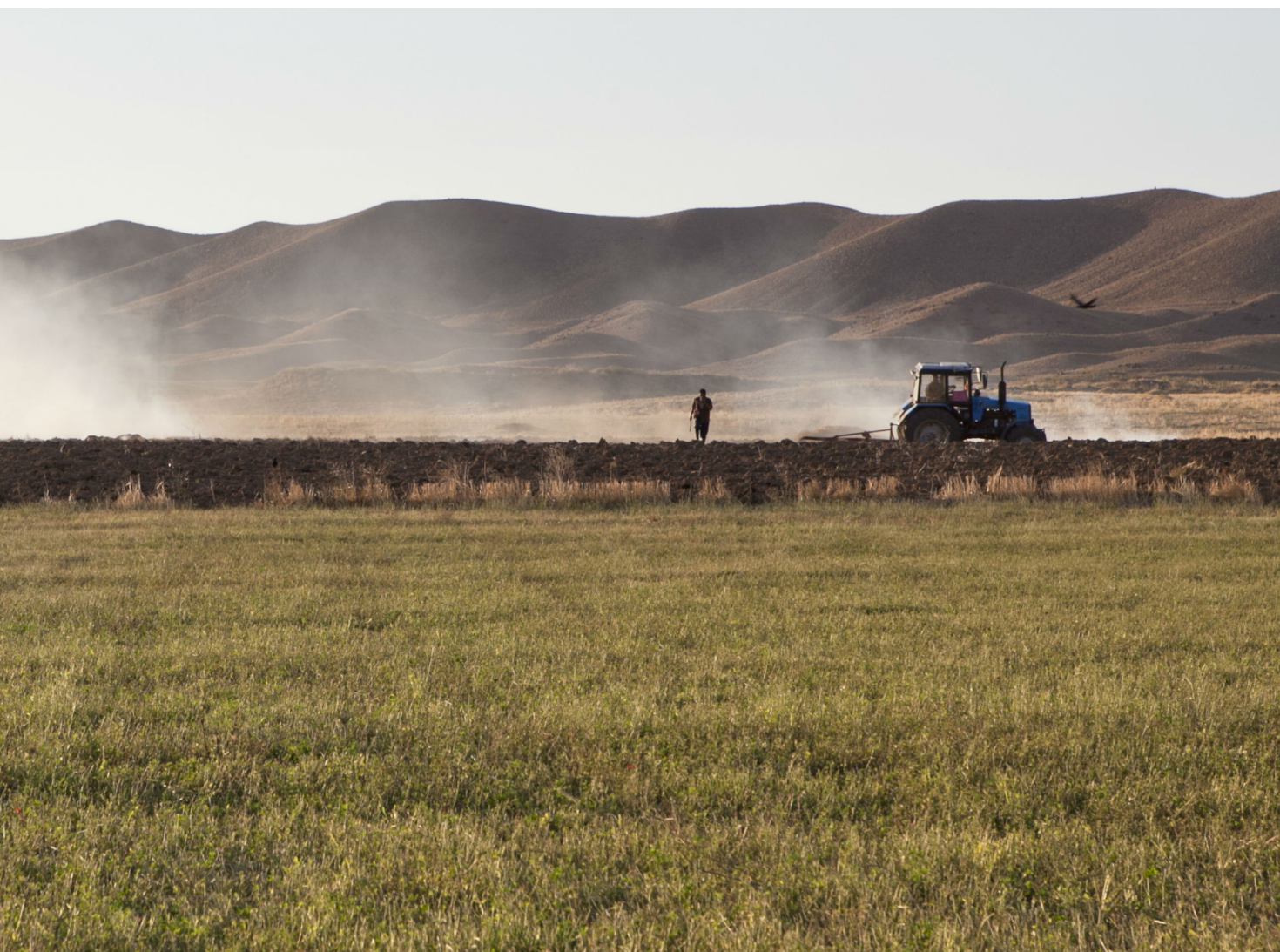
დამუშავებული ფერმერული მიწა ნახიჩევანის (აზერბაიჯანი) გზაზე

გენდერული თანასწორობა და დემოკრატიული მმართველობა ყველა პროგრამის საზიარო თემაა. ამ თემებზე ყურადღების გამახვილებით შვეიცარიის თანამშრომლობის სტრატეგია ცდილობს მოაგვაროს ისეთი ურთიერთდამოკიდებული საკითხები, რომლებიც ხელს უშლის მშვიდობასა და განვითარებას. მნიშვნელოვანი და ინკლუზიური ეკონომიკური განვითარებისათვის უსაფრთხო და უვნებელი გარემოა საჭირო, რასაც ემატება მყარი მმართველობითი სტრუქტურები. ასევე აუცილებელია სამომავლოდ კონფლიქტების თავიდან აცილება და ხელშეწყობა საჯარო მომსახურების უკეთესი ხარისხის მისაღებად. სტრატეგია შემდეგ ორ მიმართულებას გამოყოფს: 1) ინკლუზიური და მდგრადი ეკონომიკური განვითარება და 2) ეფექტური დემოკრატიული ინსტიტუტები, ადამიანის უსაფრთხოება და დაცვა.