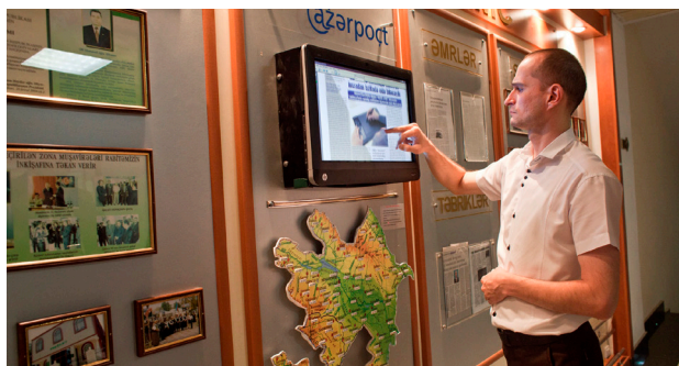
აზერბაიჯანში სოფლად მაცხოვრებელ მოსახლეობას ახლა შეუძლია გადარიცხოს, გადაცვალოს და მიიღოს ფული. ამის საშუალებას „აზერპოსტის“ ახალი ფინანსური მომსახურება იძლევა.

საქართველოში შვეიცარიამ მნიშვნელოვანი წვლილი შეიტანა იძულებით გადაადგილებულ პირებთან (IDP), სოციალურად დაუცველ და ბუნებრივი კატასტროფებით დაზარალებულ პირებთან დაკავშირებული პოლიტიკის შემუშავებაში. ამის შედეგად იძულებით გადაადგილებულ პირთა საარსებო წყაროსა და საცხოვრებელთან დაკავშირებული საკითხები შევიდა დევნილთა საარსებო წყაროების სამოქმედო გეგმასა და დევნილთა მიმართ სტრატეგიის სამოქმედო გეგმაში. აქვე აღსანიშნავია, რომ შვეიცარიის დახმარებამ - კერძოდ, 181 ოჯახს მიეცა შემოსავლის გაზრდის ახალი შესაძლებლობები, ასევე მცირე სათემო ინფრასტრუქტურას (იგულისხმება ამბულატორიები და საბავშვო ბაღები), რომელიც 3,700 ოჯახზე მეტს ემსახურება, ჩაუტარდა რეაბილიტაცია - წვლილი შეიტანა საქართველოში სოციალურად დაუცველი ადამიანების ეკონომიკურ ინტეგრაციასა და კეთილდღეობაში.