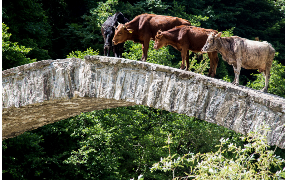
სტრატეგია ითვალისწინებს ამ სამ ქვეყანას შორის ხიდების აგებას, მაგალითად, ცხოველთა იდენტიფიკაციისა და მიკვლევადობის რეგიონული მიდგომის მეშვეობით.

საქართველოს მთავრობამ გამოთქვა მზადყოფნა, იმოქმედოს აფხაზეთსა და ცხინვალთან/სამხრეთ ოსეთთან შესარიგებლად. საქართველოს მთავრობის ასეთი ნაბიჯი შესაძლოა მოიცავდეს სხვა დონორებთან პარტნიორობას და საკუთარი რესურსების ინვესტირებას ნდობის გაზრდისა და შერიგების ღონისძიებებში ე.წ. საზღვრის ორივე მხარეს. ამგვარი ინიციატივები, სავარაუდოდ, მოიცავს საზღვრის გასწვრივ სასოფლო-სამეურნეო და სავაჭრო მოქმედებას. თუ ამგვარი დამოკიდებულება შენარჩუნდება, მაშინ SDC-ს მიეცემა შესაძლებლობა, რომ თავისი ძალისხმევა აფხაზეთთან რეგიონული ეკონომიკური კავშირების გასაძლიერებლად მიმართოს, რაც დაემატება HSD-ის ჩართულობას კონფლიქტების ტრანსფორმაციის საქმეში.