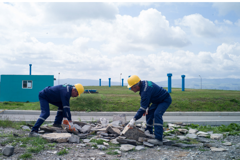
წყლის ინფრასტრუქტურის რეაბილიტაციისა და სამშენებლო სამუშაოების შედეგად აზერბაიჯანის სოფლის მოსახლეობას უკვე რეგულარულად მიეწოდება სასმელი წყალი.

მმართველობისა და საჯარო სამსახურის სფეროში შვეიცარიამ მხარი დაუჭირა რეფორმებს, რომელთა დახმარებითაც რეგიონულ და ადგილობრივ მმართველობით ორგანოებს გადაეცათ უფლებამოსილებები, მოქალაქეები უფრო აქტიურად ჩაებნენ დაგეგმვისა და გადაწყვეტილებების მიღების პროცესში, ხოლო სახელმწიფო რესურსების გამოყენება დაიწყო უფრო გამჭვირვალედ და ეფექტურად. შვეიცარიის დახმარების წყალობით საქართველოსა და სომხეთში ეროვნული, რეგიონული თუ ადგილობრივი ხელისუფლება უკეთ ახერხებს საკანონმდებლო ჩარჩოს შექმნასა და სოციალურ-ეკონომიკური განვითარების სტრატეგიებისა თუ შესაბამისი ბიუჯეტის ჩამოყალიბებას. ადმინისტრაციული მომსახურების მიწოდების მიზნით შეიქმნა და გაუმჯობესდა „ერთი ფანჯრის პრინციპი“ და ელექტრონული მმართველობის სისტემები. სომხეთში თემების გაზრდის პროცესის მეშვეობით, რომელსაც ხელს უწყობს შვეიცარია, უკვე 165,000-ზე მეტმა ადამიანმა მიიღო უფრო ხარჯთეფექტიანი და უკეთესი ხარისხის მომსახურება. ასევე გაიზარდა ქალთა მონაწილეობა პოლიტიკურ პროცესებში. აზერბაიჯანში საჯარო ინფრასტრუქტურის ინვესტიციის თანადაფინანსებამ და ტექნიკურმა დახმარებამ გააუმჯობესა საჯარო მომსახურების მიწოდება, მათ შორის, კომუნალური მომსახურება და უძრავი ქონების უფრო მარტივად რეგისტრაცია.