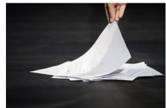
MAGDA TOFFLER. Versuch über das Schweigen