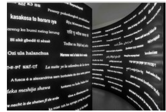
(c) Vera Röhm, VG Bild Kunst Bonn . Vera Röhm, Laborinth, Die Nacht ist der Schatten der Erde in 251 Sprachen, 2007/2021

📍 CADORO – Zentrum für Kunst und Wissenschaft in Mainz August-Horch-Straße 14 55129 Mainz