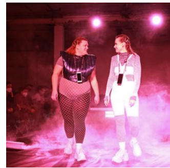
© Dorothea Tuch FLAMES TO DUST