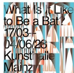
© Zheng Mahler, What is it like to be a (virtual) bat?, 2022 Bat mosaic in an ancestral family temple, Lantau Island, Hong Kong, Courtesy the artists