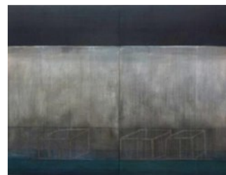
© Aliska Lahusen - Pluie 4, 2017, Mixed media. 210x280cm