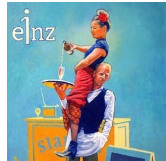
LE BISTRO - EINZ