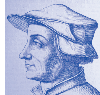
Huldrych Zwingli (1484–1531), Reformator von Zürich.