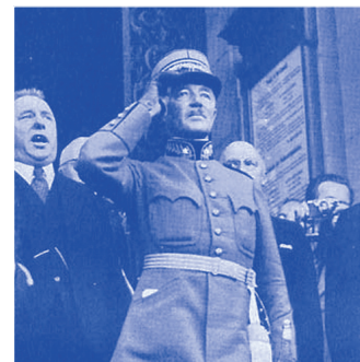
Henri Guisan (1874–1960), General im 2. Weltkrieg.