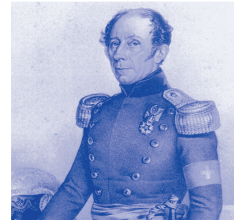
Henri Dufour (1787–1875), General, Ingenieur, Kartograf.