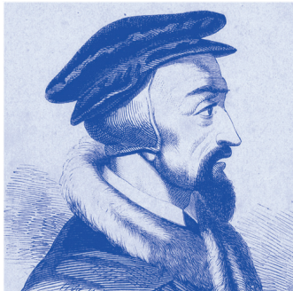
Johannes (Jean) Calvin (1509– 1564), Reformator von Genf.