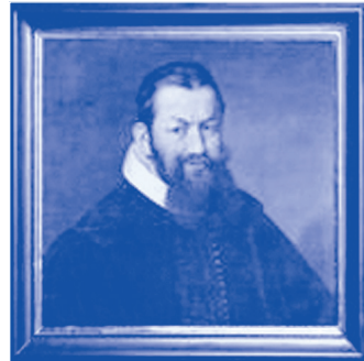
Johann Rudolf Wettstein (1594–1666), Initiator der Unabhängigkeit vom deutschen Reich.