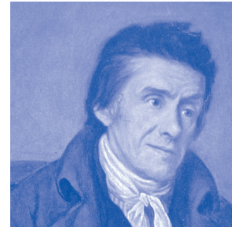
Johann Heinrich Pestalozzi (1746–1827), Pädagoge und Menschenfreund.