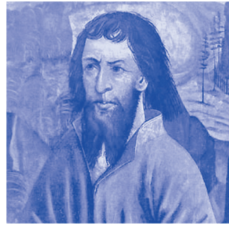
Niklaus von Flüe (1417–1487), Eremit, Vermittler und Ratgeber der Eidgenossen.