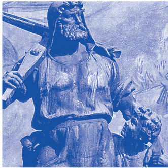
Wilhelm Tell (ca. 1290), Schweizer Nationalheld.