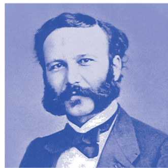
Henry Dunant (1828–1910), Gründer des Roten Kreuzes (1863).