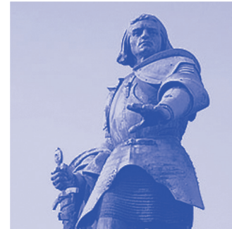
Adrian von Bubenberg (1428– 1479), Schultheiss von Bern, Verteidiger von Murten.