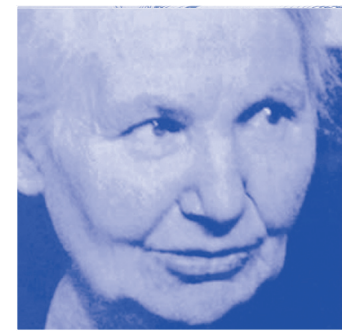
Gertrud Kurz (1890–1972), Flüchtlingsmutter im 2. Weltkrieg.