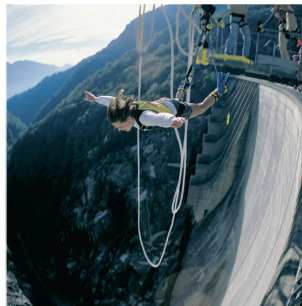
...runter kommen sie immer! Bungeejumping im Tessin...