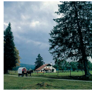
...sanfte Abenteuerromantik dagegen beim Pferdetrekking im Jura.