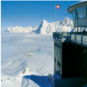
Agentenland: Auf dem Schilthorn besiegte 007 James Bond den Bösewicht Blofeld.