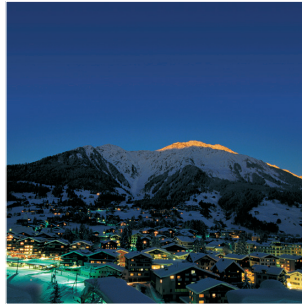
Märchenland: Vielleicht sitzt hier in Klosters gerade Prinz Charles in einem Pub.