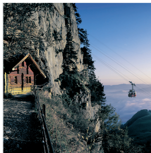
...oder sich vor Technik und Natur verneigen in der Ostschweiz (Appenzellerland)...