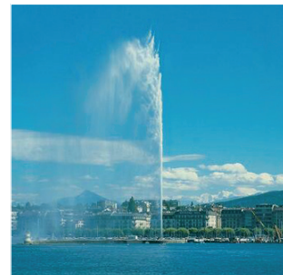
...stolz und schön wie eine Diva, die Stadt Genf: UNO-Stadt, Kultur- und Grenzstadt.