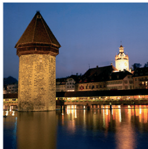
...viel Geschichte atmet die Stadt Luzern mit ihrem prächtigen historischen Kern...