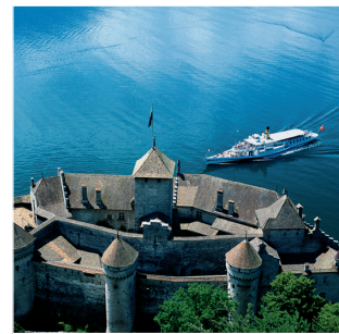
...oder Lust auf eine Visite im Schloss Chillon in Montreux am Genfersee?