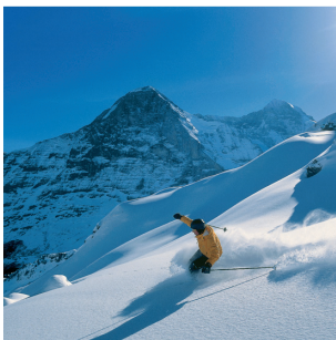
Ausflugsland: Einfach den Winterzauber genießen im Berner Oberland...