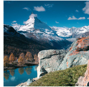
Liebesland: Das Matterhorn, häufig gefilmte Szenerie für Bollywood-Lovestories.