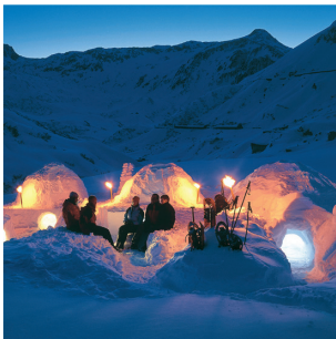
Abenteuerland: Das Handy ist eingefroren, die Seele warm im Iglu in den Waadtländer Alpen...