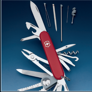
Swiss Army Knife