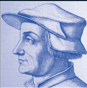
Huldrych Zwingli (1484–1531), Reformator von Zürich.