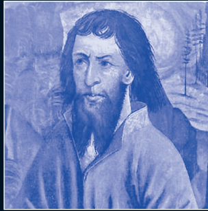
Niklaus von Flüe (1417–1487), Eremit, Vermittler und Ratgeber der Eidgenossen.