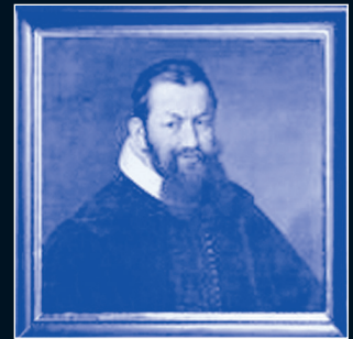
Johann Rudolf Wettstein (1594– 1666), Initiator der Unabhängig- keit vom deutschen Reich.