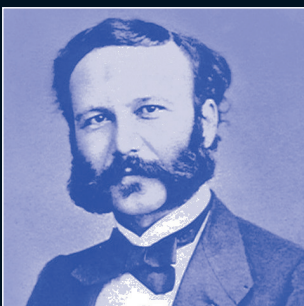
Henry Dunant (1828–1910), Gründer des Roten Kreuzes (1863).