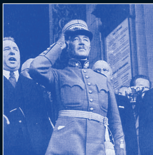
Henri Guisan (1874–1960), General im 2. Weltkrieg.