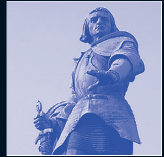
Adrian von Bubenberg (1428– 1479), Schultheiss von Bern, Ver- teidiger von Murten.