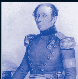
Henri Dufour (1787–1875), General, Ingenieur, Kartograf.