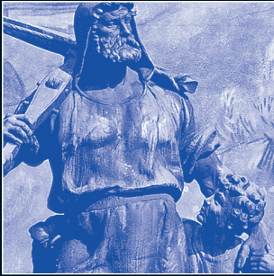
Wilhelm Tell (ca. 1290), Schweizer Nationalheld.