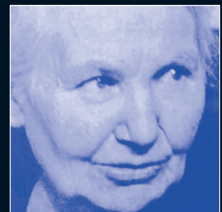
Gertrud Kurz (1890–1972), Flüchtlingsmutter im 2. Weltkrieg.