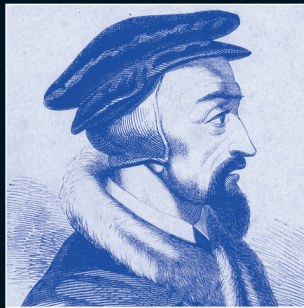
Johannes (Jean) Calvin (1509– 1564), Reformator von Genf.