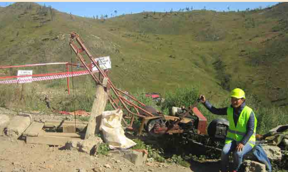
Мөнгөнцэцэг ажлын талбар дээрээ.

Сэлэнгэ аймгийн Мандал сумын жихүүн өглөө... Уурхайчдын хувьд бэрхшээл ойртож буйг зөгнөх мэт. Гадаа -10 хэмээс хүйтэрч газар хөлдөх үед тэдний ажиллах хугацаа хоёр дахин уртасна.