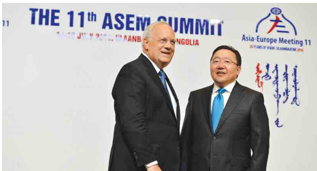
АСЕМ-ын 11-р дээд хэмжээний чуулга уулзалтын үеэр Монгол Улсын Ерөнхийлөгч Ц. Элбэгдорж ШХУ-ын Ерөнхийлөгч Иохан-Амманн Шнайдерыг хүлээн авч уулзжээ.

Олон улсын харилцааны хувьд Монгол улс 2016 онд АСЕМ-ын 11 дүгээр дээд хэмжээний чуулга уулзалтыг амжилттай зохион байгууллаа. Энэ нь тус улсын хувьд олон улсын хамтын ажиллагаагаа бэхжүүлэх, Монгол улсад ашигтай хоёр талын гэрээнүүд байгуулах томоохон боломж байлаа.