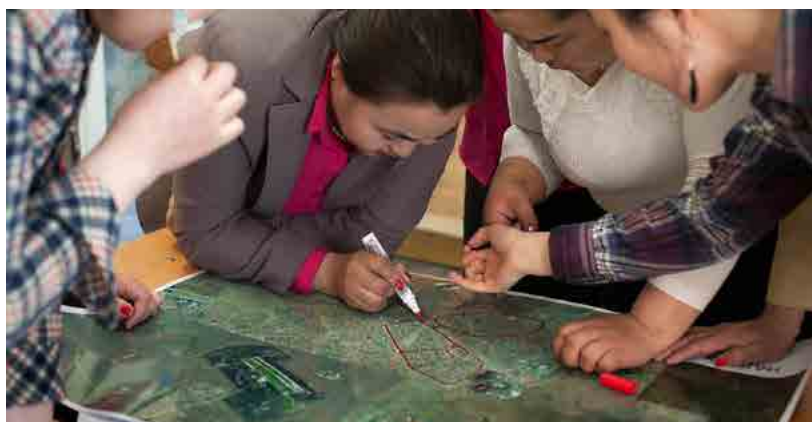
Орон нутгийн хөгжлийн сангаар хийгдсэн ажлуудыг газрын зураглал дээр буулгах ажлын үеэр Налайх дүүргийн 3 дугаар хорооны хэсгийн ахлагч нар өөрийн хэсгийн хил заагийг зурж байгаа нь.

хүртээмжийг дээшлүүлэх, тэдний эрэлт хэрэгцээнд нийцсэн төсвийн хөрөнгө оруулалтын төслүүд хэрэгжүүлэхэд дэмжлэг үзүүлэх замаар Улаанбаатар хотын гэр хорооллын иргэдийн амьдралыг сайжруулж байна. Төслөөс төв, орон нутгийн засаг захиргааны хамтын ажиллагааг сайжруулах, иргэд, иргэний нийгмийн байгууллагуудын төрийн хэрэгт оролцох оролцоог нэмэгдүүлэх замаар хотын захын болон гэр хорооллын өрхүүдэд үзүүлэх төрийн үйлчилгээний чанар, хүртээмжийг дээшлүүллээ. Улаанбаатарын гэр хорооллын 2800 гаруй өрхийг (түүний дотор бага орлоготой 396, ганц бие өрхийн тэргүүнтэй 320, эмэгтэй өрхийн тэргүүнтэй 280, хөгжлийн бэрхшээлтэй гишүүнтэй 230 өрх) төлөөлсөн 12 хорооны (нийт 150 хорооноос) иргэд төрийн үйлчилгээний чанар, хүртээмжийг сайжруулахад чиглэсэн 12 үйлчилгээг хамтран тодорхойлоод байна.