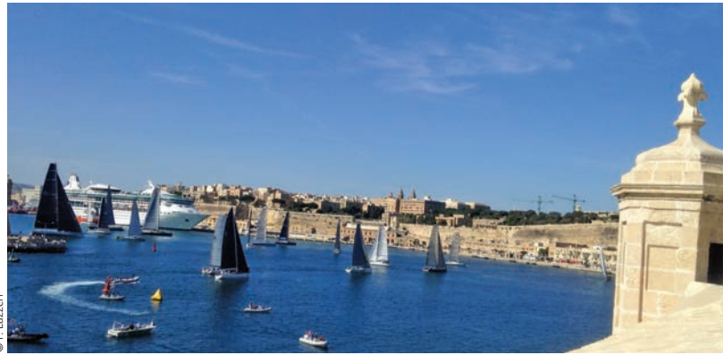
Valletta – Hauptstadt von Malta / La Valette – capitale de Malte

Schweizer Botschaft in Italien, Malta und San Marino Ambassade de Suisse en Italie, Malte et Saint-Marin