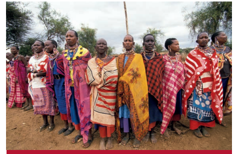
Eine Gruppe von Frauen in traditionellen Kleidern in Kenia. Die Kultur der indigenen Bevölkerung darf durch Entwicklungsprojekte nicht gefährdet werden.

unterschiedliche, ja gegenläufige Interessen und Überzeugungen vertreten, unter einen Hut zu bringen. Dabei hat sich ein pragmatischer Ansatz herauskristallisiert: Das, was möglich ist, wird unterstützt, gleichzeitig wird jedoch die Anwendung überwacht. Diese Position vertritt auch die Schweiz. Die Einführung der Standards wird sich über einen Zeitraum von mehreren Jahren erstrecken. Für ihre Überwachung hat die Bank eine erhebliche Aufstockung der Mittel vorgesehen.