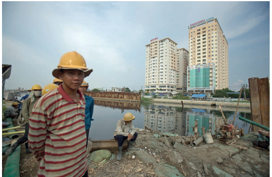
Die städtische Entwicklung – hier in Vietnam – kann sich negativ auf die Umwelt oder auf die Rechte der Arbeitnehmenden auswirken. Bei den von der Weltbank unterstützten Projekten sollen Standards zur Vermeidung von Missbrauch beitragen.

Die grossen Entwicklungsbanken legen Schutzmassnahmen fest, um die sozialen und ökologischen Folgen der Projekte, die sie finanzieren, zu bewältigen. Auch die Weltbank hat vor kurzem ihre Schutzvorkehrungen, die so genannten Safeguards, überarbeitet. Für einige sind sie ein Rück-, für andere ein Fortschritt.