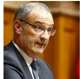
Der neu gewählte Bundesrat Guy Parmelin