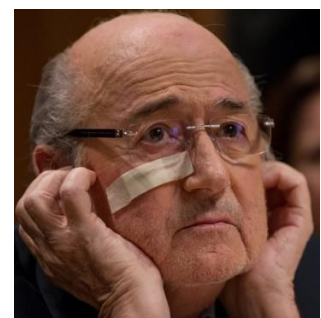
Sepp Blatter für acht Jahre gesperrt

« Swiss authorities missed chance to investigate Fifa's Sepp Blatter in 2002 » (The Guardian)