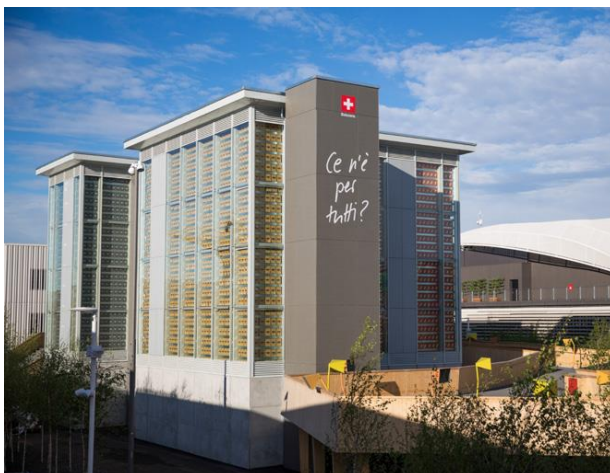
Der Schweizer Pavillon an der Weltausstellung 2015 in Mailand

Die Medienberichterstattung über den Schweizer Pavillon an der Weltausstellung 2015 in Mailand war insbesondere in Italien ausführlich und in der Tonalität positiv. Insgesamt wurden rund 1'650 Beiträge in internationalen Medien gezählt und 1'800 Journalistinnen und Journalisten im Pavillon empfangen. Die Kernbotschaften des Schweizer Pavillons – nachhaltiger Umgang mit Ressourcen, verantwortungsvoller Konsum und Erhalt des Lebensraums für zukünftige Generationen – konnten wirkungsvoll verbreitet werden. Mit beinahe 40'000 Fans und Follower auf Facebook, Twitter und weiteren Kanälen der Social Media gehörte der Schweizer Pavillon auch im Bereich der neuen Medien zu den erfolgreichsten der Weltausstellung.