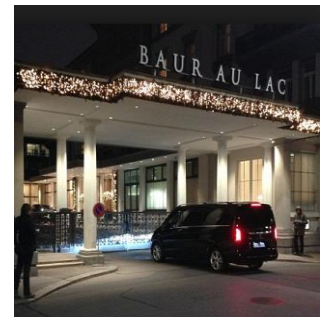
Ort der Verhaftungen von zwei weiteren FIFA-Funktionären: Das Hotel Baur au Lac in Zürich