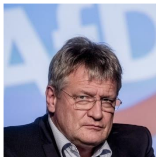
Le dirigeant de l'AfD Jörg Meuthen sous pression en raison de financements douteux en provenance de Suisse