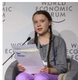
La militante suédoise pour le climat Greta Thunberg durant une table ronde au WEF