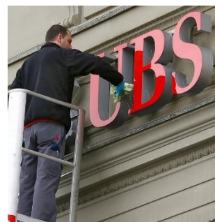
UBS condamnée à une amende de plusieurs milliards dans le cadre de son différend fiscal avec la France

Ministère public zurichois a également attiré l'attention des médias. Bien que l'accent soit principalement mis sur les représentants de l'AfD et non sur la Suisse, l'écho médiatique continu donné à cette affaire a pour incidence l'association de notre pays à un soutien électoral illégal et à des financements de provenance douteuse.