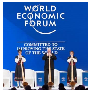
Joueurs de cor des Alpes à la cérémonie d'ouverture du WEF

l'attention. La presse étrangère a aussi évoqué les autres personnalités présentes, ainsi que l'absence de plusieurs chefs d'État importants. On trouve également des articles plus critiques qui remettent en question la devise du WEF, « améliorer l'état du monde ». Mais dans