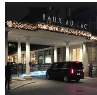
Lieu des arrestations de deux autres fonctionnaires de la FIFA: l'Hôtel Baur au Lac à Zurich