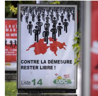
Affiche de campagne pendant les élections fédérales

« Fear of immigration swings Switzerland even farther right » ( The Economist )