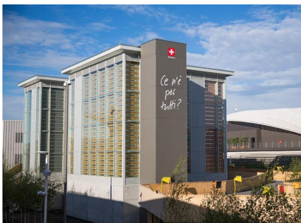
Le Pavillon suisse à l'Exposition universelle 2015 à Milan

Le Pavillon suisse à l'Exposition universelle 2015 à Milan a fait l'objet d'une couverture médiatique approfondie et positive, surtout en Italie. Au total, 1'650 articles ont été recensés dans les médias étrangers et 1'800 journalistes ont été accueillis au Pavillon. Les messages clés du Pavillon – rapport durable aux ressources, consommation responsable et préservation de l'environnement pour les générations futures – ont pu être diffusés efficacement. Avec près de 40'000 fans et followers sur Facebook, Twitter et autres canaux digitaux, le Pavillon suisse est parmi ceux qui ont rencontré le plus de succès durant l'Exposition y compris dans le domaine des nouveaux médias.