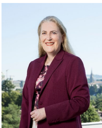
Helene Budliger Artieda Segretaria di Stato Segreteria di Stato dell'economia (SECO) Dipartimento federale dell'economia, della formazione e della ricerca (DEFR)

Il Consiglio federale si aspetta che le imprese svizzere, indipendentemente dal fatto che operino nel nostro Paese o all'estero, rispettino i Principi guida delle Nazioni Unite su imprese e diritti umani (di seguito «Principi guida dell'ONU») e applichino procedure di dovuta diligenza in materia di diritti umani. A tal fine, l'Esecutivo sostiene le imprese mediante strumenti mirati, consulenze, formazioni e opportunità di fare rete. Il Piano d'azione nazionale (PAN) su imprese e diritti umani 2024–2027 fa seguito all'omonimo piano per il periodo 2020–2023, che è stato valutato e, in base ai risultati della valutazione, aggiornato per rispondere alle nuove realtà, in particolare alle novità normative. Il PAN mira a promuovere l'applicazione dei Principi guida dell'ONU e definisce nuove misure volte a integrare il rispetto dei diritti umani nelle attività economiche della Confederazione e delle imprese svizzere, indipendentemente da dimensione, struttura, settore o ambito di attività.