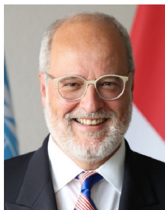
Alexandre Fasel Segretario di Stato Segreteria di Stato Dipartimento federale degli affari esteri (DFAE)