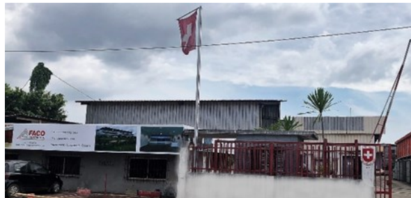
Consulat à Libreville