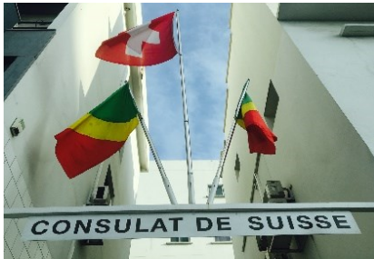
Consulat à Pointe-Noire